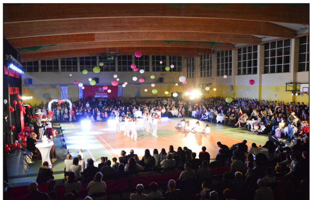
Festiwal cieszył się ogromnym zainteresowaniem