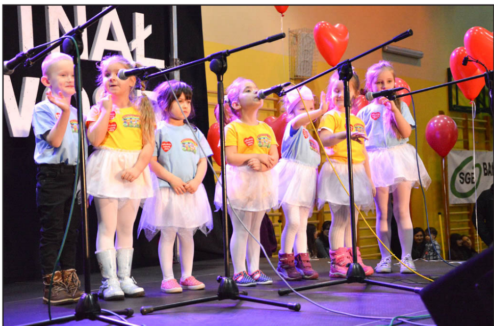
Program artystyczny uświetniły występy przedszkolaków

Przez cały dzień relacje na żywo ze sławieńskiej imprezy można było śledzić na profilach społecznościowych, profilu sławieńskiego WOŚP-u oraz na Ogólnopolskiej Mapie Wydarzeń przygotowanej przez patrona medialnego – telewizję TVN. Miejski Sztab Wielkiej Orkiestry Świątecznej Pomocy w Sławnie dziękuje jeszcze raz wszystkim wolontariuszom, sponsorom, darczyńcom, lokalnym mediom i wszystkim mieszkańcom za udzieloną pomoc bo przecież gramy do końca świata i jeden dzień dłużej.