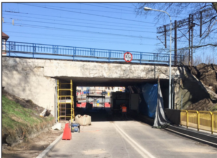
Remont wiaduktu potrwa do końca kwietnia br.

Z początkiem marca br. ruszyły pierwsze prace przy remoncie wiaduktu kolejowego przy ul. Koszalińskiej w Sławnie, zlecone przez PKP Polskie Linie Kolejowe S.A., na wniosek Burmistrza Miasta Sławno.