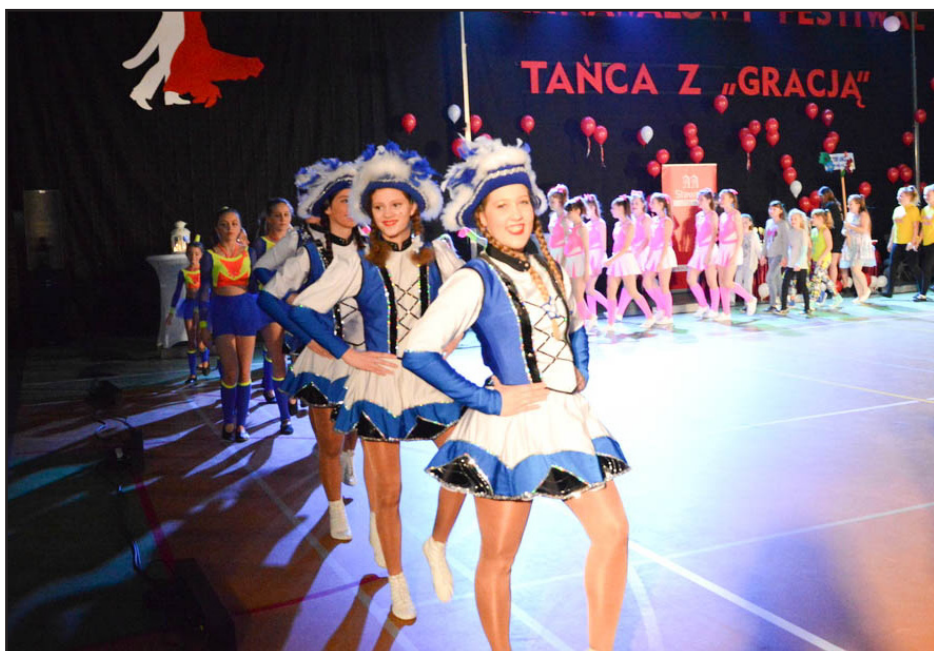
W festiwalu uczestniczyli tancerze z partnerskiego miasta Rinteln

Był to niezwykle piękny wieczór pełen elegancji i gracji. Za organizację tej wyjątkowej imprezy należy również podziękować rodzicom dzieci i sponsorom, którzy zapewni-li profesjonalną i przepiękną oprawę całego festiwalu. A już w przyszłym roku Organizatorzy zapraszają na jubileuszowy X Karnawałowy Festiwal Tańca z „Gracją”.