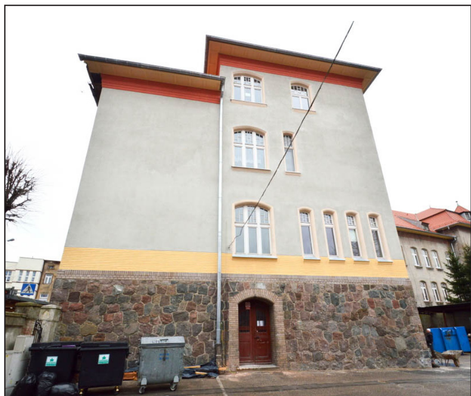
Nowa elewacja budynku

Ze względu na zły stan techniczny firma PPH Arkomet Sp. z o.o. z Mławy wykonała nową elewację dwóch ścian budynku ratusza, dostosowaną do charakterystyki budynku według zaleceń konserwatora zabytków.