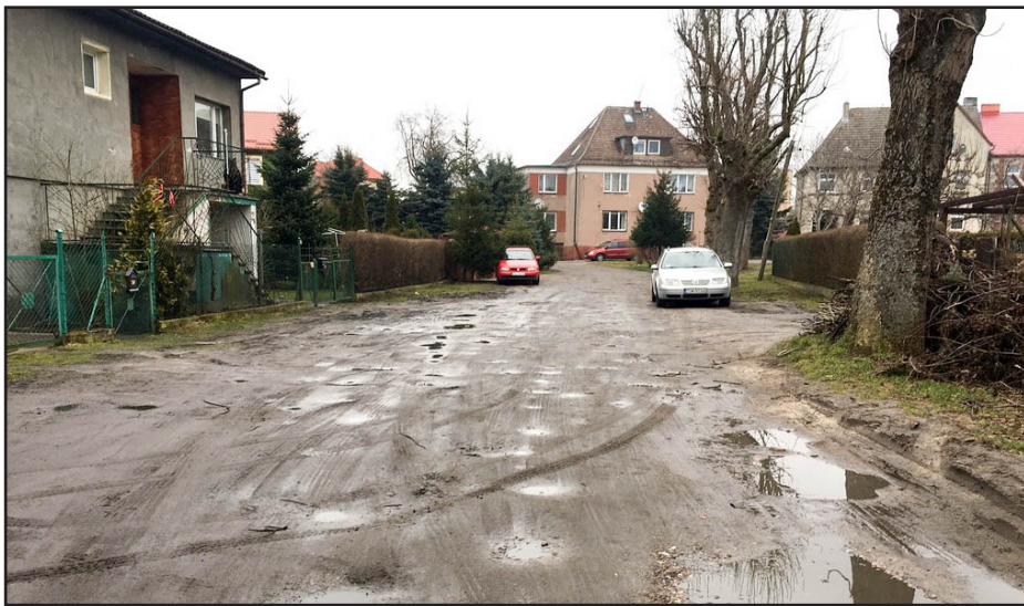
Przebudowie poddane zostaną odcinek od ul. Chopina do ul. Chrobrego

W marcu br. ogłoszono postępowania przetargowe na przebudowę proscenium i widowni amfiteatru oraz przebudowę odcinka Alei Zachodniej w Sławnie.