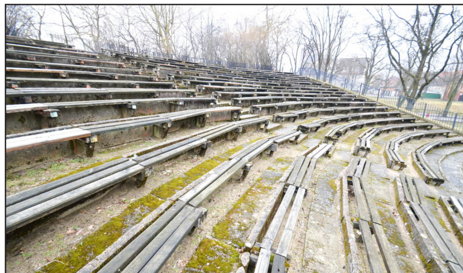
Remont amfiteatru potrwa do 30 lipca 2017 roku.