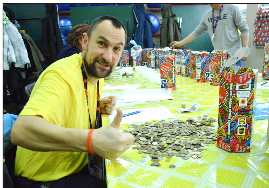
Wolontariusze liczyli zebrane środki do późnych godzin wieczornych