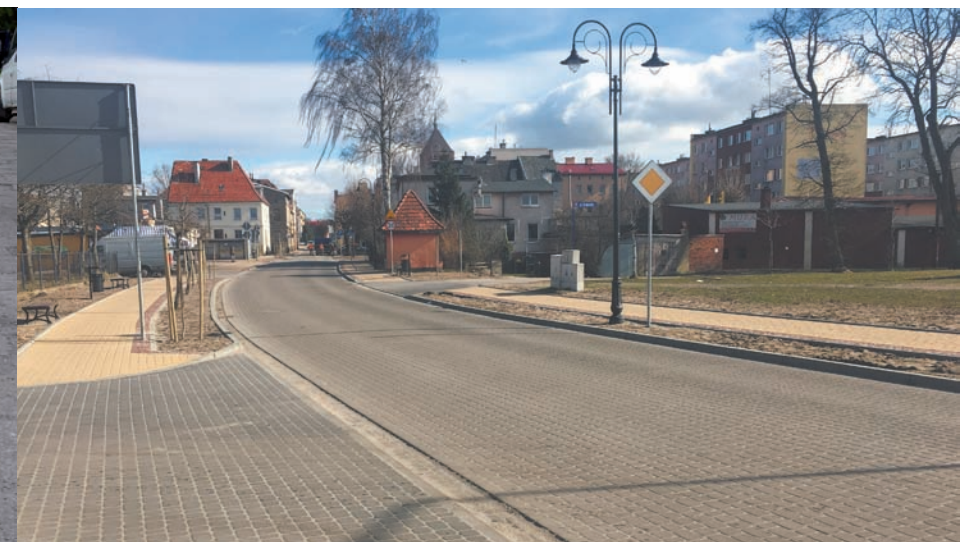
Ulica Mickiewicza przed i po przebudowie