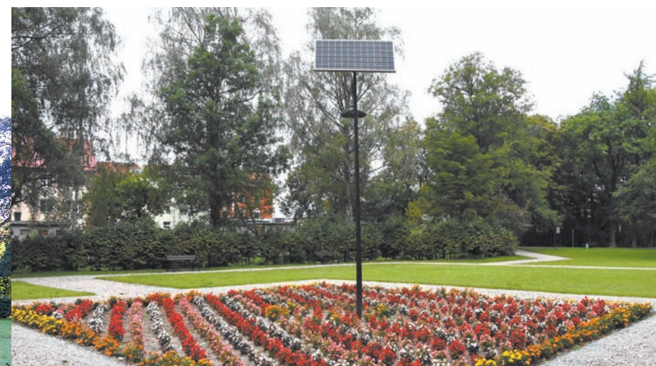
Park przy byłym budynku Gimnazjum Miejskiego w Sławnie przed i po przebudowie