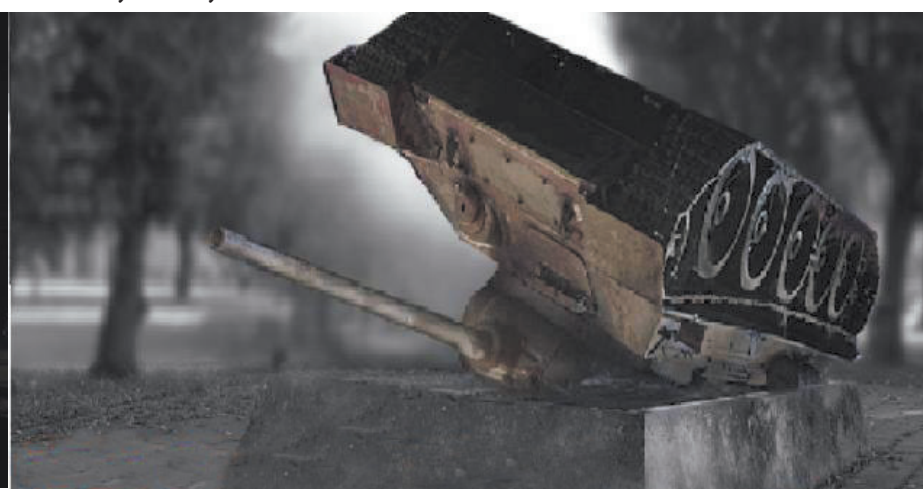
Po lewej - przebudowany skwer w świątecznej odsłonie. Po prawej - propozycja zagospodarowania skweru przez oponentów. Wizualizacja odwróconego czołgu autorstwa Jerzego Kaliny.