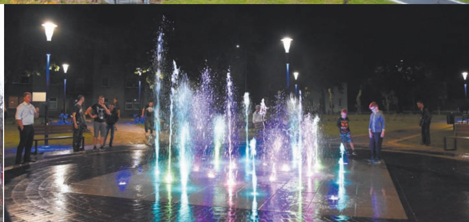
W centralnym punkcie przebudowanego skweru przy ul. Armii Krajowej, w miejscu czołgu powstała fontanna z podświetleniem LED. Czołg trafił do Muzeum Techniki i Techniki Wojskowej w Malechowie.