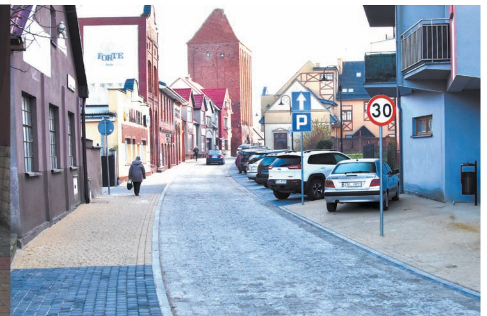
Ulica Basztowa przed i po przebudowie