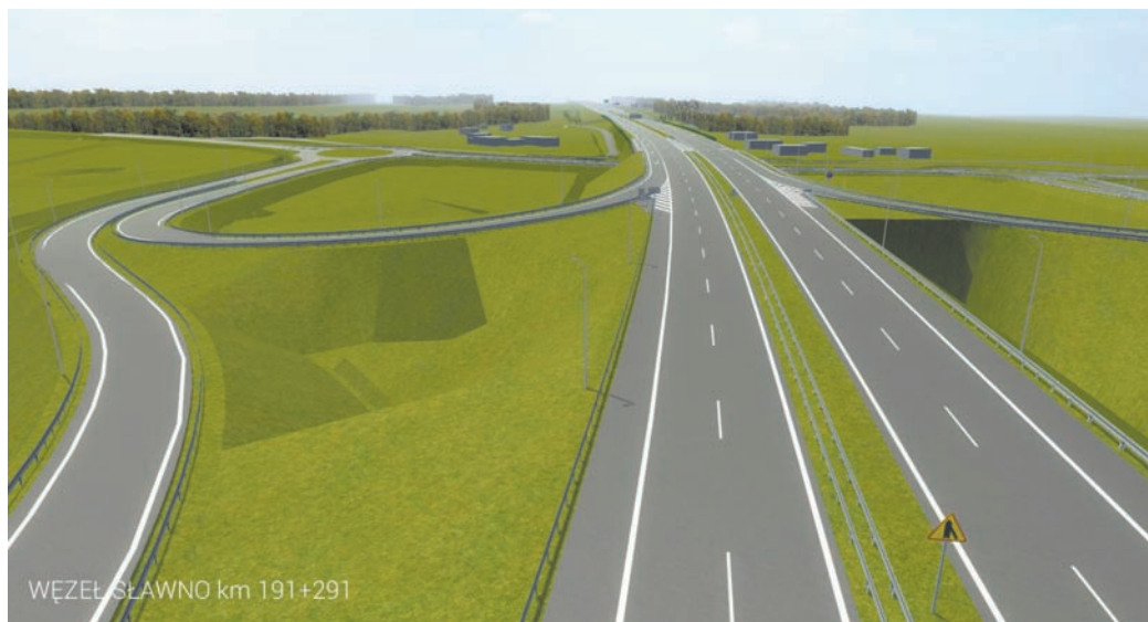
Wizualizacja drogi S6 na odcinku Koszalin-Sławno i Sławno-Słupsk