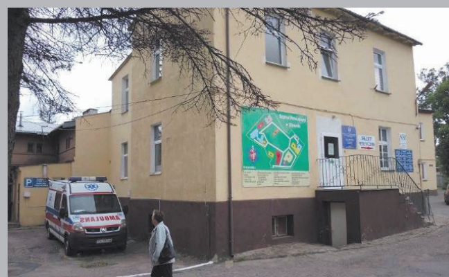
Debata w sprawie sławieńskiego szpitala str. 8