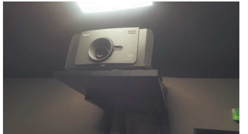
Nowy projektor cyfrowy ze zgodnością z DCI