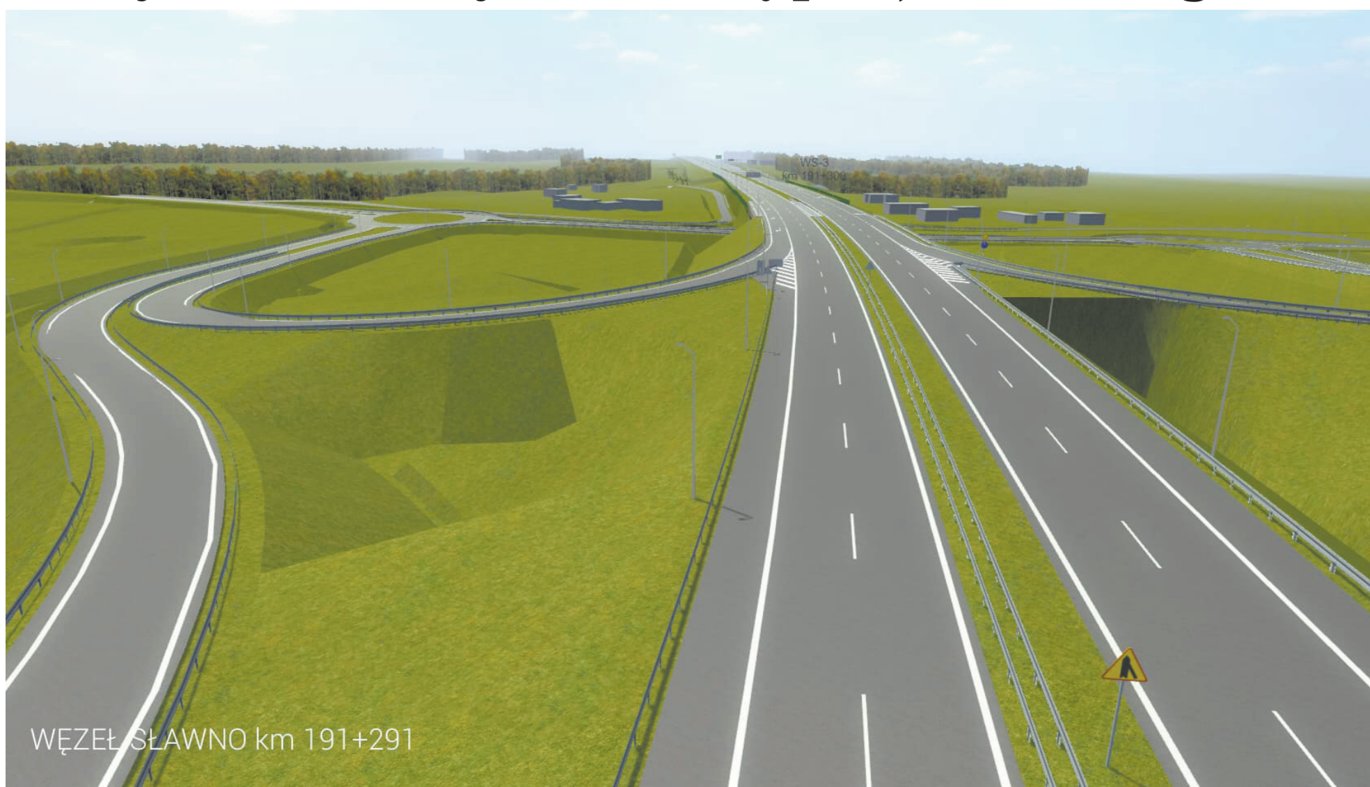
WĘZEŁ SŁAWNO km 191+291

G eneralna Dyrekcja Dróg Krajowych i Autostrad podpisała umowy na zaprojektowanie S6 na odcinkach Koszalin - Sławno i Sławno - Słupsk. To łącznie 46,2 km. Wykonawcą obu dokumentacji będzie firma Mosty Gdańsk, a łączna wartość umów to