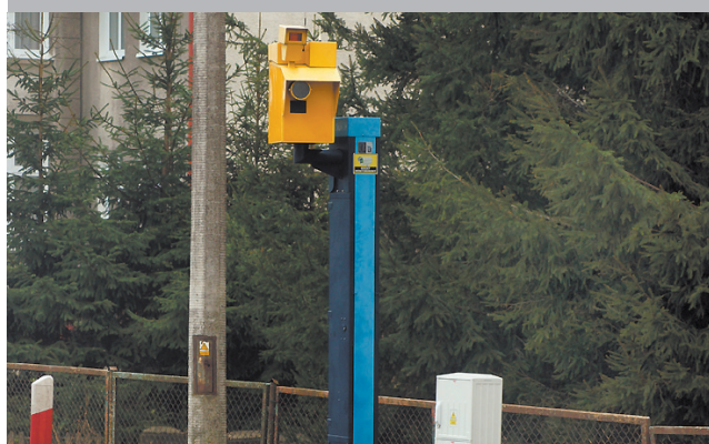
Zamontowano fotoradar na ul. Koszalińskiej str. 3