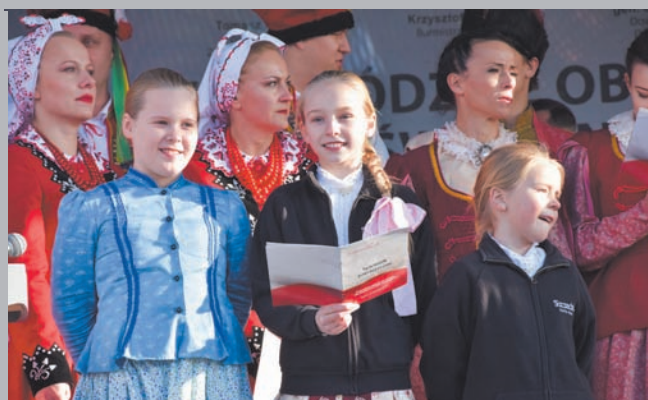
Podsumowanie Wojewódzkich Obchodów Święta Niepodległości w Sławnie str. 7