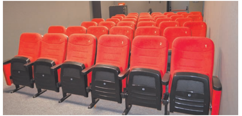
Nowa sala kinowa posiada 42 miejsca siedzące

Kolejnym etapem realizowanym w SDK będzie utworzenie nowego stanowiska kasowego, instalację systemu kasowego, serwera i kasy fiskalnej. Nowe stanowisko ma łączyć nowoczesne zastosowania technologiczne z klasyczną przestrzenią architektury neogotyckiej. Realizacja powyższych zadań pozwoli stworzyć miejsce, które z dumą będzie mogło nosić nazwę stolicy kultury powiatu sławieńskiego. Koszt całego projektu to ponad 66 tysięcy złotych.