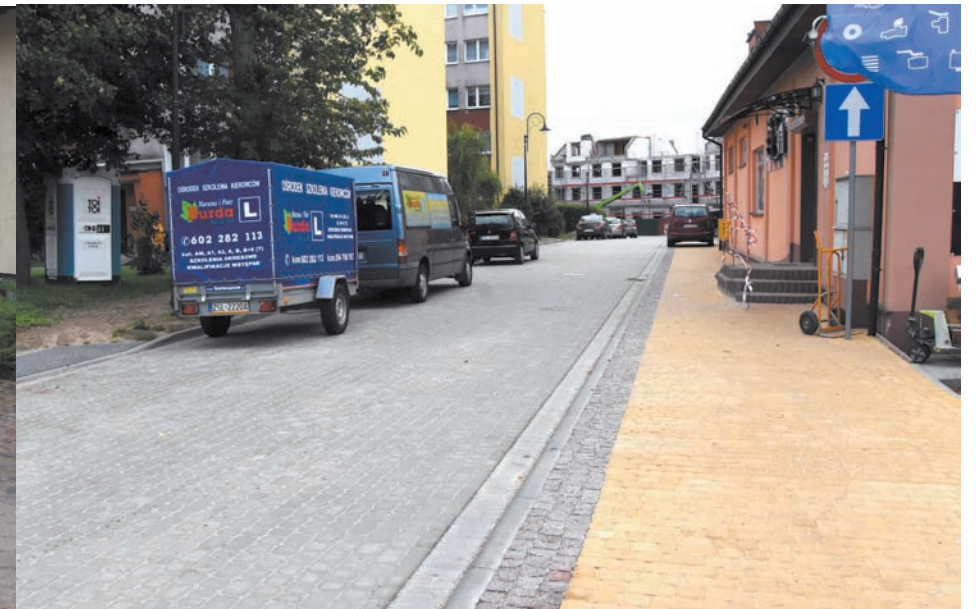
Ulica Matejki przed i po przebudowie