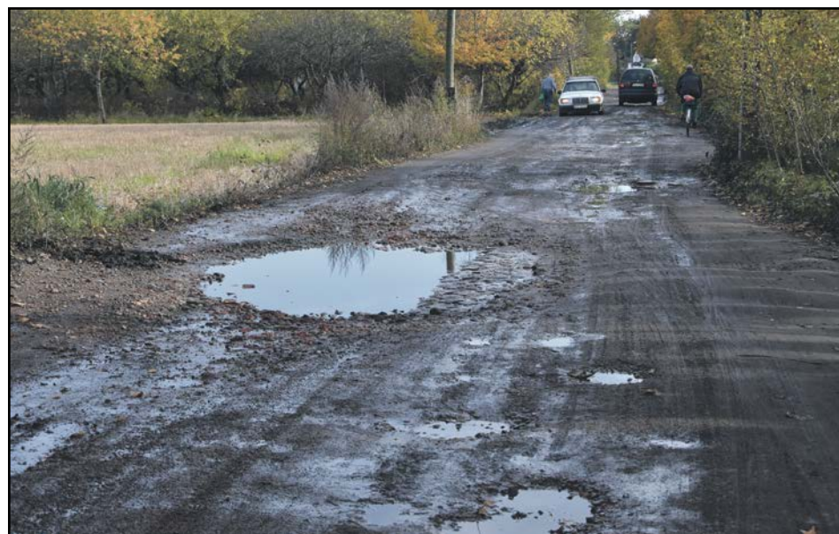
Przedsiębiorcy od wielu lat zabiegali o remont końcowego odcinka ul. Chełmońskiego. Nowa droga zapewni lepszy dojazd do znajdujących się w tym rejonie firm.