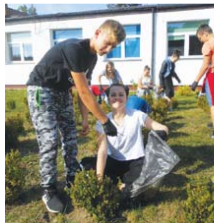
... i Niemicy