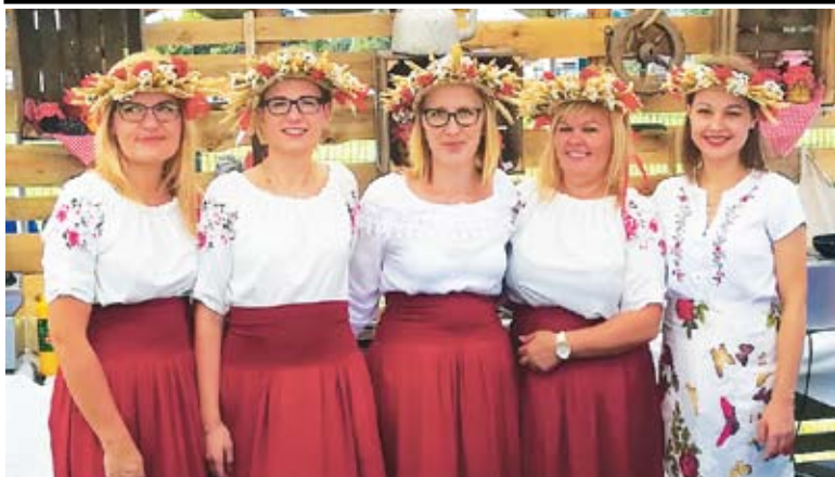
Piękne Panie z Sołectwa Gorzyca

łom Gminy Malechowo za wkład w organizację imprezy, a mieszkańcom Malechowa za piękne ozdobienie wsi. Oczywiście to nie był koniec, bo w uczestnicy imprezy bawili się do białego rana przy muzyce na żywo.