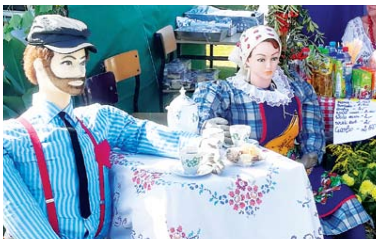
Plac dożynkowy zachwycał oryginalnymi ozdobami

wych stoisk i uczestniczenie w naszej imprezie. Dzięki Wam Dożynki Gminne 2018 stały na tak wysokim poziomie. Wszystko dzięki zaangażowaniu mieszkańców gminy i drzemiącemu w nich potencjałowi... Stoiska rywalizowały, jako co roku, w Konkursie na Najpiękniejsze Stoisko Dożynkowe 2018. Ocena kolorowych i oryginalnych stoisk dożynkowych nie była łatwa. Komisja oceniała walory estetyczne wykonania zagród, złożoność konstrukcji, elementy dekoracyjne oraz walory smakowe serwowanych dań i produktów. I tak: I miejsce i nagrodę 500 zł przyznano jednocześnie Sołectwu Gorzyca i Sołectwu Przystawy. II miejsce i nagroda 300 zł przypadło Sołectwu Karwice, III miejsce i nagrodę 200 zł wywalczyło Sołectwo Malechówko. Komisja Konkursowa nie miała też łatwego zadania podczas oceny wieńców. Po długich obradach zdecydowano, że I miejsce i czek o wartości 500 zł powędruje do Sołectwa Gorzyca, II miejsce wywalczyło Sołectwo Nie-