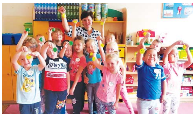
Dzieci z Przedszkola przy ZS w Ostrowcu