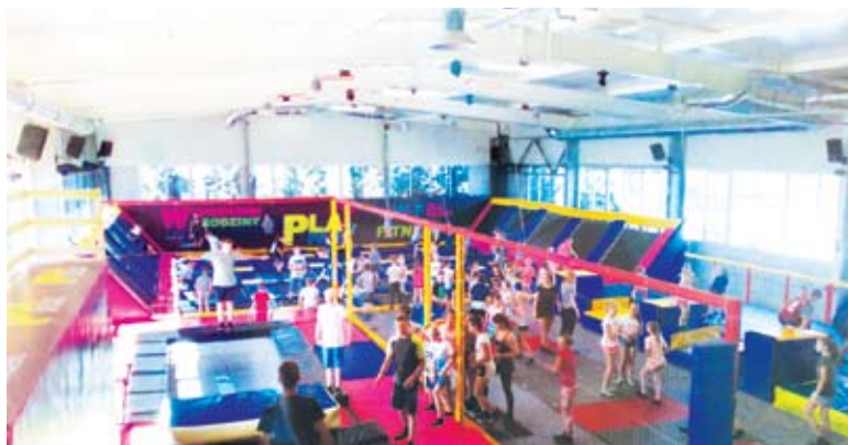
... i wycieczka do Parku Trampolin