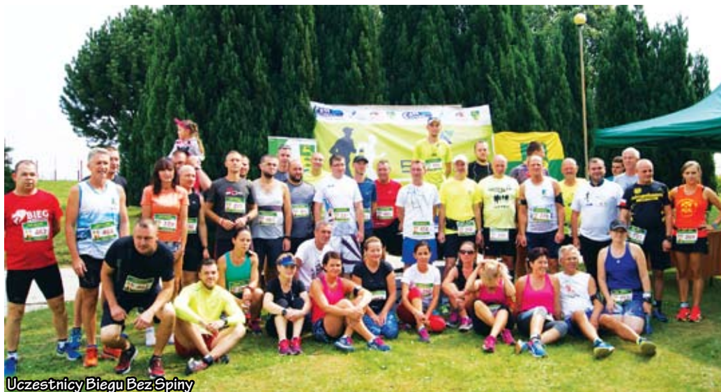
Uczestnicy Biegu Bez Spiny

Dla uczestników biegu zakupione zostały pakiety startowe wraz z upominkiem oraz ciepły posiłek. Mając na względzie zdrowie i bezpieczeństwo zawodników przygotowano odpowiednie zabezpieczenie medyczne. Środki na ten cel pozyskano z projektu „Pobiegijmy razem dla siebie” w ramach programu Społecznik 2018, o które aplikował Klub Sportowy Arkadia Malechowo. Bieg prowadził Komendant Gminny OSP - Ro-