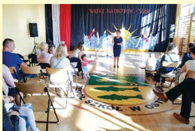
Zespół Szkół w Ostrowcu