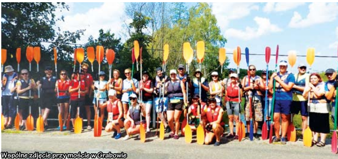
Wspólne zdjęcie przy moście w Grabowie

Tegoroczny spływ zorganizowany został na rzece Grabowej, gdzie w obszarze Natura 2000 PLH320003 Dolina Grabowej realizowane są niektóre działania projektu. Miejsce startu spływu to jednocześnie jedno z wybranych miejsc, w których projekt zakłada urządzenie tarlisk dla ryb poprzez uzupełnienie żwiru w rzece, którego niedostatek uniemożliwia odbycie tarła. Planowane działanie poprawi również atrakcyjność dosyć monotonnej, choć zwawo płynącej na tym odcinku rzeki. Liczna w tym roku grupa uczestników została przywita-