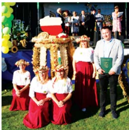
Najpiękniejszy Wieniec 2018 wykonali mieszkańcy Gorzycy.