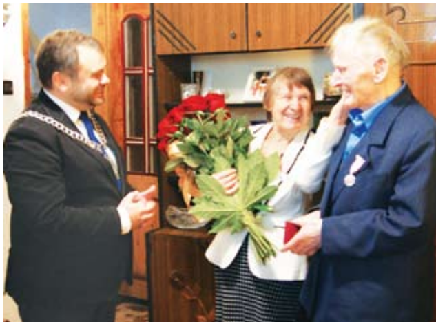
Jubilaci z uśmiechem świętowali 60-tą rocznicę swojej miłości