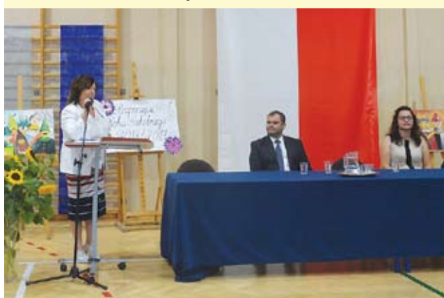
Szkoła Podstawowa w Niemicy