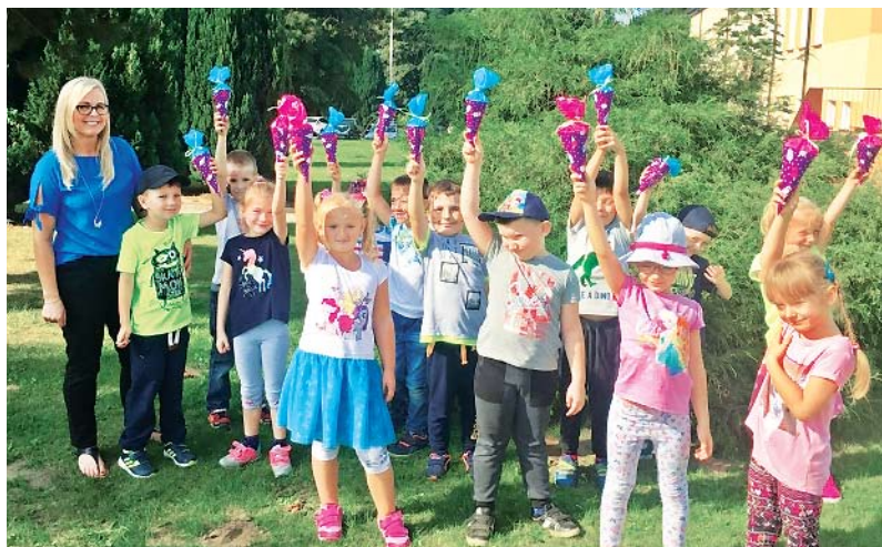
Dzień Przedszkolaka w Malechowie na wesoło. Były cukierkowe paczki...