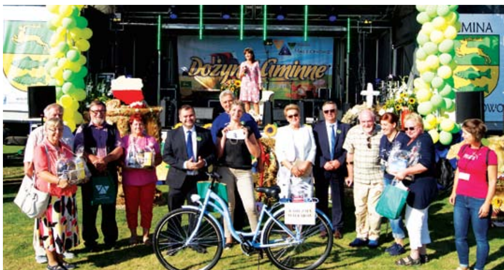
Uczestnicy i zwycięzcy jednego z wielu konkursów.

Po oficjalnym otwarciu imprezy rozpoczęto część artystyczno-rozrywkową. Były minikoncerty zespołu "Ostrowianie" z Ostrowca, zespołu ludowego "Słoneczko" z Niemicy, zespołu wokalnogitarowego "Minutki" z Ostrowca oraz muzyków z formacji "Nasze Wspomnienia" z Ostrowca. O dobrą zabawę i taneczną formę zadbała też grupa taneczna z Koszalin z pokazem zumbi. Plac dożynkowy w tym roku wyglądał zdumiewająco. Słowa uznania należą się sołectwom i innym grupom, które przygotowały wyszukane i pełne rustykalnych elementów stoiska wystawiennicze. Zadbały też o smaczne dania. Można tu było posmakować pierogów, bigosu, gulaszu, a nawet zakręconej frytki, kebaba, domowych ciast i wielu innych smakowitości. A to za sprawą: sołectw (Przystawy, Gorzyca, Karwice, Bartolino, Sulechowo, Malechówko), klubu seniora z Malechowa, koła gospodyń wiejskich z Niemicy, stowarzyszenia "Ostrowianie" z Ostrowca. W tym miejscu składamy serdeczne podziękowania dla wystawców za przygotowanie urokli-