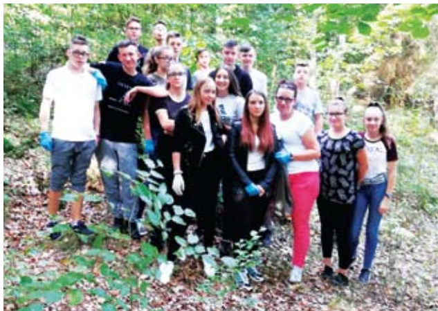
Sprzątaли w Lejkowie...

Efekty przemysłanej edukacji i kształtowania prawidłowych postaw od najmłodszych lat wśród dzieci i młodzieży są nieocenione. Wiedzą o tym doskonale nauczyciele ze szkół i przedszkoli naszej gminy. Co roku, z zapalem organizują akcję sprzątania świata i uczą swoich podopiecznych, że najważniejsza jest troska o nasze środowisko i niezasmiecanie planety ziemi. Najpierw pokazu-