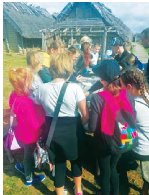
Wprawa na wyspę Wolin

gotowanych atrakcji: wyjazdów do kina, do parków zabaw i rozrywki, wyjazdów na wycieczki do Centrum Słowian i Wikingów na wyspie Wolin, gdzie dzieci mogły cofnąć się w czasie i przekonać jak 1000 lat temu mieszkali, pracowali i walczyli Wikingowie oraz Słowianie. Warsztaty lepienia z gliny, produkcji filcu, pisanie gęsimi piórami, musztra wczesnośredniowieczna, strzelanie z łuku, pieczone podplomyki z odrobiną miodu, marmolady lub twarożku to wspaniałe