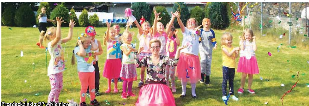
Przedszkolaki z SP w Niemicy