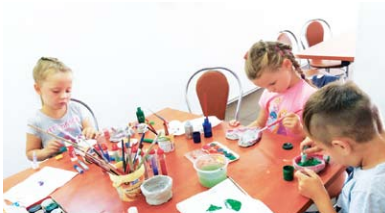
Zajęcia artystyczne z malarstwa w Niemicy