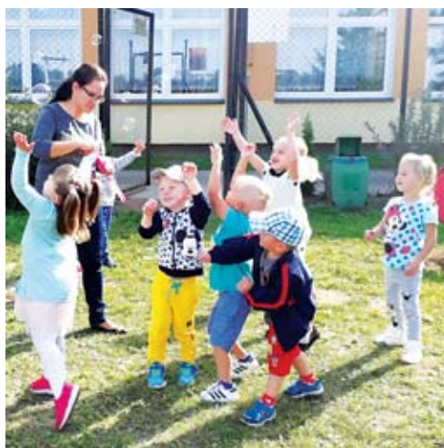
...i zabawa z bańkami

20 września obchodzony jest Ogólnopolski Dzień Przedszkolaka.