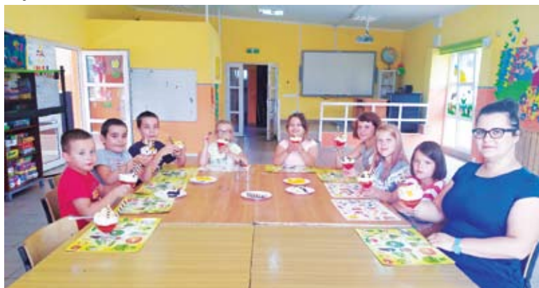
Były też letnie desery w PWD Laski