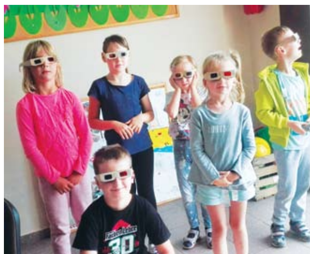
Kolorowe wakacje w Sulechowie