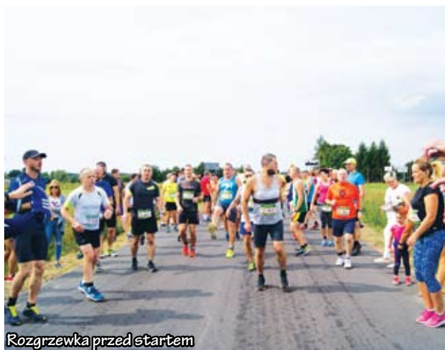
Rozgrzewka przed startem

nia biegaczy zostały spełnione, a bieg wpisze się na stałe do kalendarza imprez w naszej gminie. Biegacze! Do zobaczenia za rok!