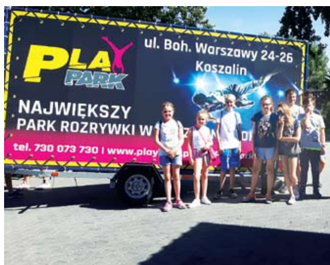
PWD Świącianowo w Play Parku