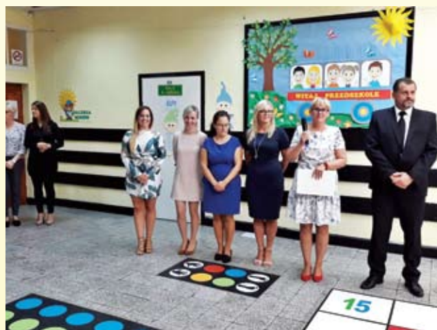
Przedszkole w Malechowie