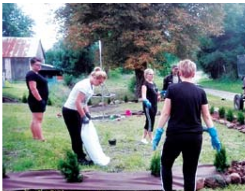
Obsadzenie terenu rekreacyjnego to zasługa mieszkańców Gorzycy.

Kwota dotacji to 3000 zł, która w całości została wykorzystana na pierwszy bieg w Gminie Malechowo na dystansie 10 km. W ramach dotacji zakupiony został dla biegaczy pakiet startowy wraz z upominkiem oraz przygotowany ciepły posiłek. Dzięki takiej właśnie współpracy Gminy Malechowo z aktywnymi stowarzyszeniami możliwa była organizacja I Biegu bez Spiny, którego obszerną relację zamieściliśmy w tym wydaniu Kwartalnika. Wsparcie organizacyjne ze strony klubu okazało się nieocenione, a ponad setka zawodników uczestnicząca w tym wydarzeniu i ich pochlebne opinie, potwierdzają, że w naszej gminie zainicjowano kolejną sensowną imprezę, która na stałe zagości w kalendarzu wydarzeń. Również Stowarzyszenie dla Ziemi Malechowskiej podpisało umowę