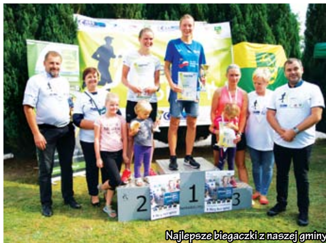
Najlepsze biegaczki z naszej gminy