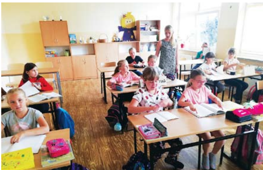
Nowa pracownia języka polskiego w Zespole Szkół w Ostrowcu

Istotnym działaniem prowadzonym w naszych szkołach jest projekt „Rozwijamy kompetencje kluczowe uczniów