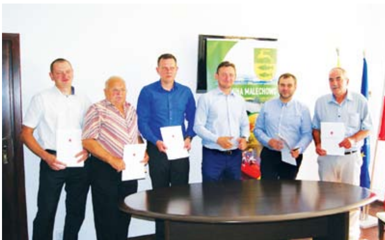
Podpisanie umów z przedstawicielem UM - wicemarszałkiem Tomaszem Sobierajem.

Sołectwo Gorzycza z projektem pn. „Aktywna Gorzycza - Siłownia pod chmurką” w ramach otrzymanych środków zakupi nowoczesny plac zabaw, a mieszkańcy w formie wolontariatu przygotowują i oczyszczą teren oraz dokonają montażu elementów zabawowych. Prace te zaplanowano na październik. Sołectwo Malechówko realizuje projekt o nazwie „Strefa relaksu i integracji”, w ramach którego zaplanowano