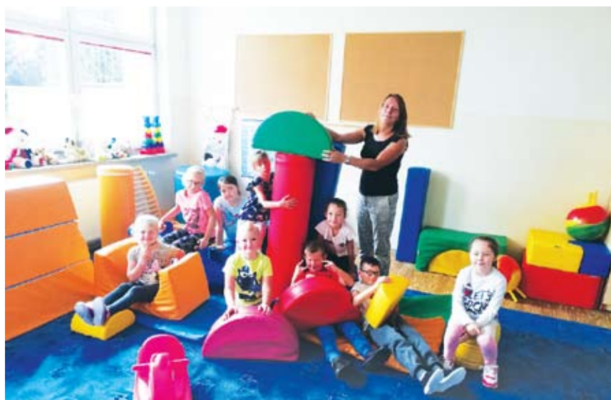
Reaktywacja Radosnej Szkoły

Ostrowcu powstała Radosna szkoła - pomieszczenie do zabaw dla dzieci, które ze względu na utworzenie 7 klasy mogą korzystać z nowego kącika. Dbamy też o zdrowie, bowiem w gabinetach szkolnych zainstalowano 4 nowoczesne elektroniczne wagi i dodano 4 w pełni wyposażone nesesery podręczne dla pielęgniarki. Uzyskane dofinansowanie to 26 332,00 zł. Szkoła kiedyś a dziś? Zmian jest dużo, w szczególności biorąc pod uwagę zeszłoroczną reformę edukacji. Wysiłek pedagogów oraz samorządu lokalnego potwierdza to, że placówki z naszej gminy zdały egzamin i doskonale dostosowały się do nowej rzeczywistości.