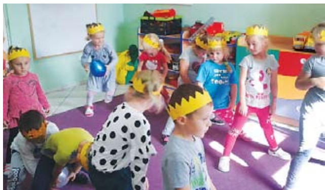
Królowie i Królowny w Przedszkolu w Kusicach

Magiczne Drzewo by odszukać Ukryty Skarb - słodkie różki różnaitości. Na zakończenie Panie złożyły dzieciom życzenia i wręczyły pamiątkowe dyplomy oraz odznaki „Super Przedszkolaka”.