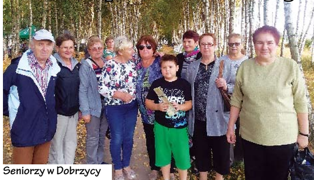
Seniorzy w Dobrzycy

Lato to okres bardzo sprzyjający wyjazdom - szczególnie krajoznawczym.