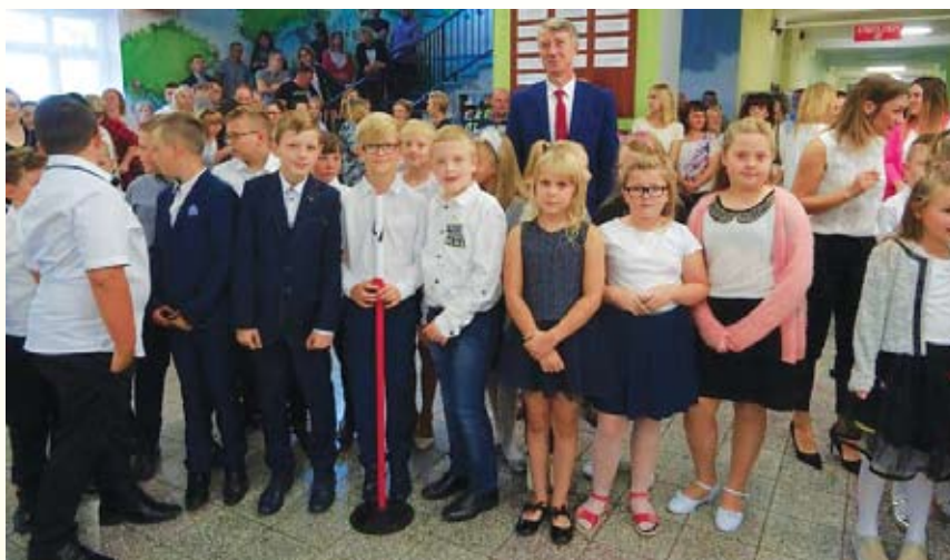
Uczniowie Szkoły Podstawowej w Malechowie