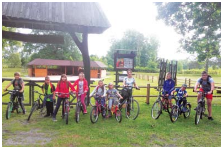
Była wycieczka rowerowa podczas zajęć sportowych w Kosierzewie

Wakacje w placówkach minęły pod znakiem realizacji projektu „Dla dobra dzieci - rozwój 13 placówek wsparcia dziennego w Gminie Malechowo”.