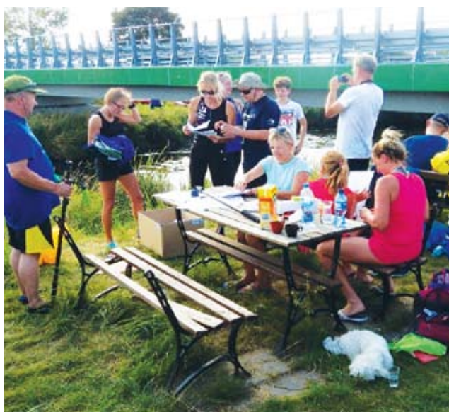
Integracja na przystani kajakowej w Grabowie po zakończonym spływie