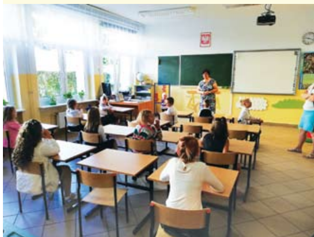
Szkoła Podstawowa w Lejkowie

Wszystkim uczniom z naszej gminy - tym większym i mniejszym - życzymy chłonności umysłu, samych dobrych wyników i kreatywnej pracy w roku szkolnym 2018 / 2019. Niech ten czas będzie dla Was pełnym przygód oraz możliwością do odkrywania zagadek i piękna tego świata.