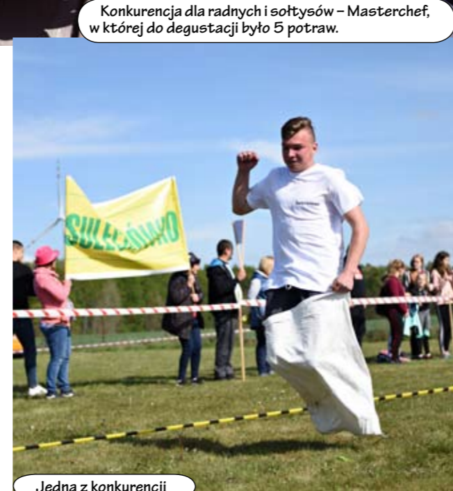
Jedna z konkurencji

sołectwo Malechówko, które serwowało dania z grilla, ciasto, zakreconą frytkę i wiele innych pyszności. Po zakończeniu turnieju gospodarze zaprosili na zabawę do białego