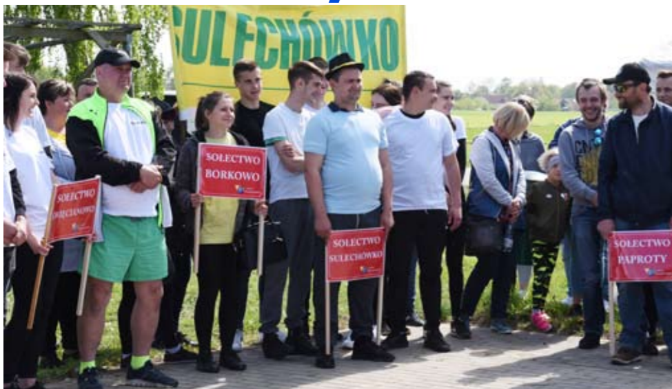
Ekipy przed startem

Za nami V Potyczki Sołeckie, w Malechówku.