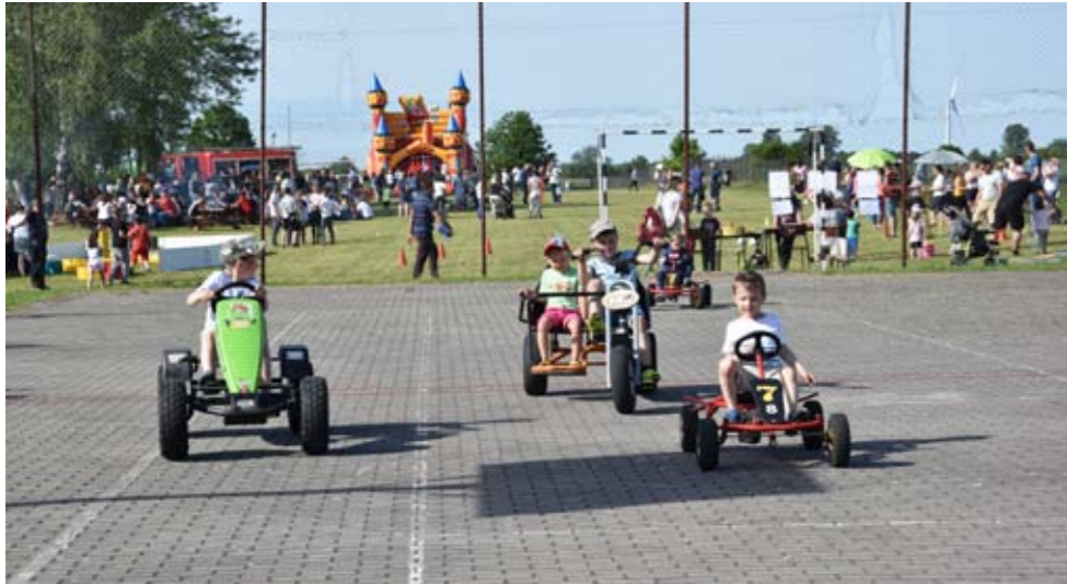
2 czerwca br. na terenie przy SP w Malechowie odbył się Trzeci Gminny Dzień Dziecka.

Dzieci zdobywały pieczątki, zaliczając poszczególne stacje za-