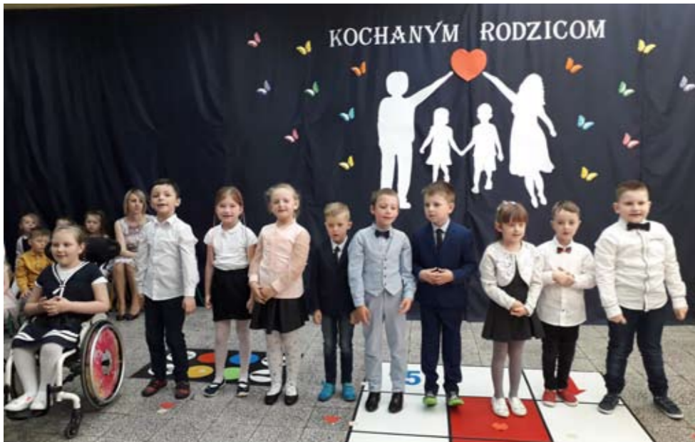
„Kochanym Rodzicom” - pod takim tytułem 24 maja 2019r. w Przedszkolu w Malechowie odbyło się radosne spotkanie Dzieci i Rodziców z okazji Dnia Matki i Ojca.

Wszystkie dzieci z bijącym sercem i wypiekami na twarzy recytowały wiersze, śpiewały piosenki, tańczyły i składały życzenia. Licznie przybyli Rodzice z podziwem i wzruszeniem oklaskiwali swe pociechy. Niejednej Mamie i nie-