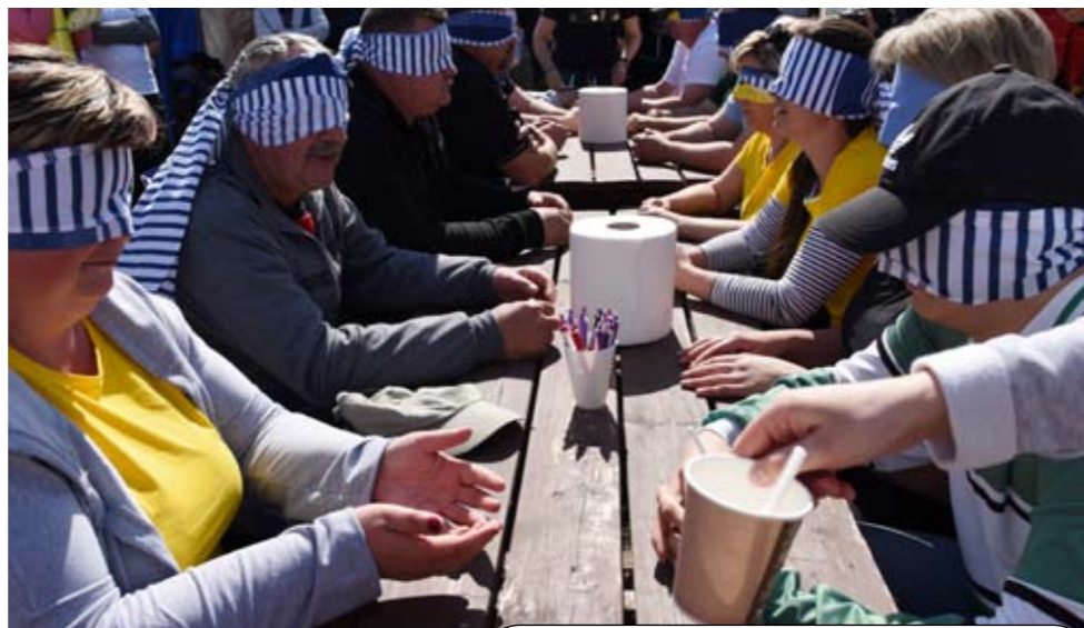
Konkurencja dla radnych i sołtysów – Masterchef, w której do degustacji było 5 potraw.

pucharami, dyplomami oraz niespodzianką Wójta Gminy Malechowo – czekiem na kwotę 100 zł za udział w V Potyczkach Sołeckich. O podniebienie gości zadbało