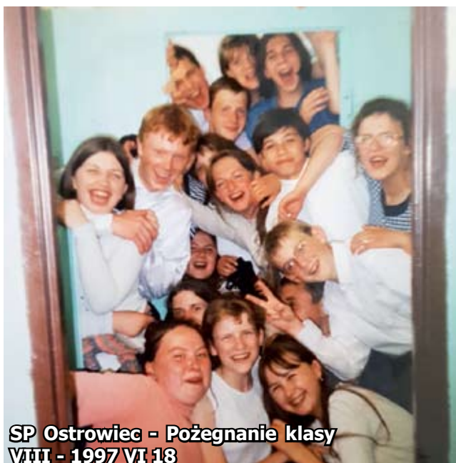
SP Ostrowiec - Pożegnanie klasy VIII - 1997 VI 18

W ramach XXX-lecia malechowskiego samorządu przypominamy, jak zmieniały się placówki oświatowe naszej gminy.