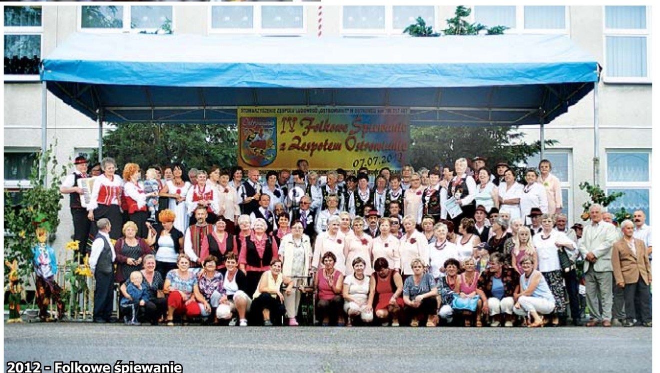
2012 - Folkowe śpiewanie

W maju tego roku malechowski samorząd świętuje swoje 30-lecie. Na przestrzeni trzech dekad doszło do znaczących zmian w jego funkcjonowaniu, zmieniła się gmina Malechowo i jej mieszkańcy. W pierwszej kadencji Rada Gminy Malechowo składała się z 20 radnych, w latach 1994-2002 zmniejszono jej liczebność do 18 osób, a od 2006 roku gminę reprezentuje 15 radnych i tak jest do dziś.