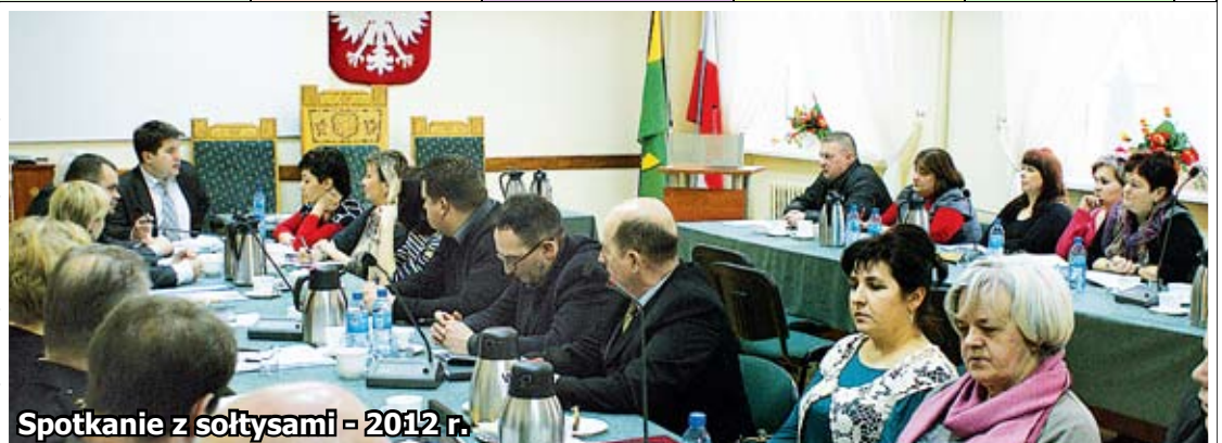
Spotkanie z sołtysami - 2012 r.