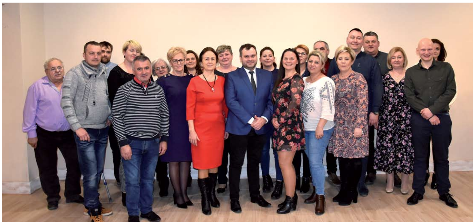
Dzień Sołtysa 2020

30 lat to okres, w którym zmieniła się nasza rzeczywistość, zmienił się malechowski urząd i samorząd. Zmieniały się rządy, wprowadzano nowe reformy, a dziś gmina jest jednostką, która realizuje cały szereg zadań własnych i