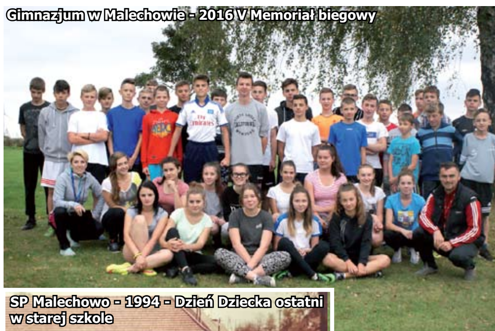
Gimnazjum w Malechowie - 2016 V Memoriał biegowy