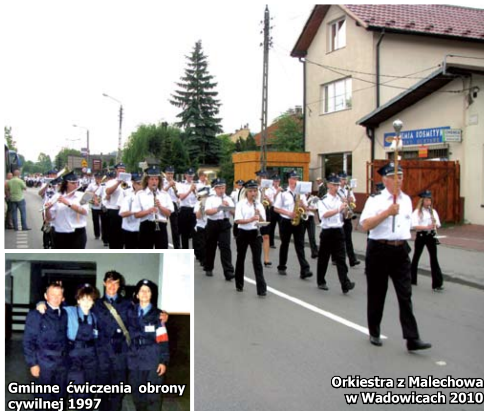
Gminne ćwiczenia obrony cywilnej 1997