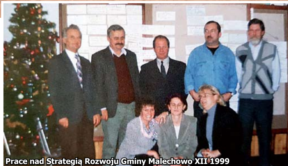
Prace nad Strategią Rozwoju Gminy Malechowo XII 1999