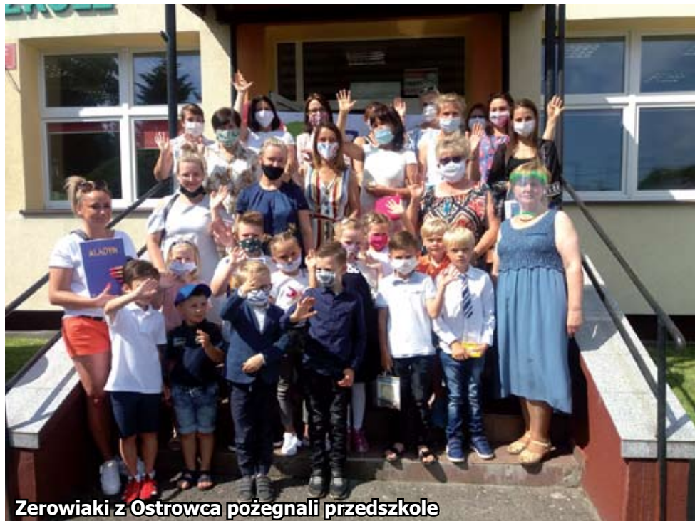
Zerowiaki z Ostrowca pożegnali przedszkole

Gdyby ktoś pół roku temu zażartował, że klasycznego zakończenia roku nie będzie, nie odbędą się akademie, a uczniowie będą odbierać świadectwa na tury w maseczkach, niejedna osoba uśmiechnęłaby się z