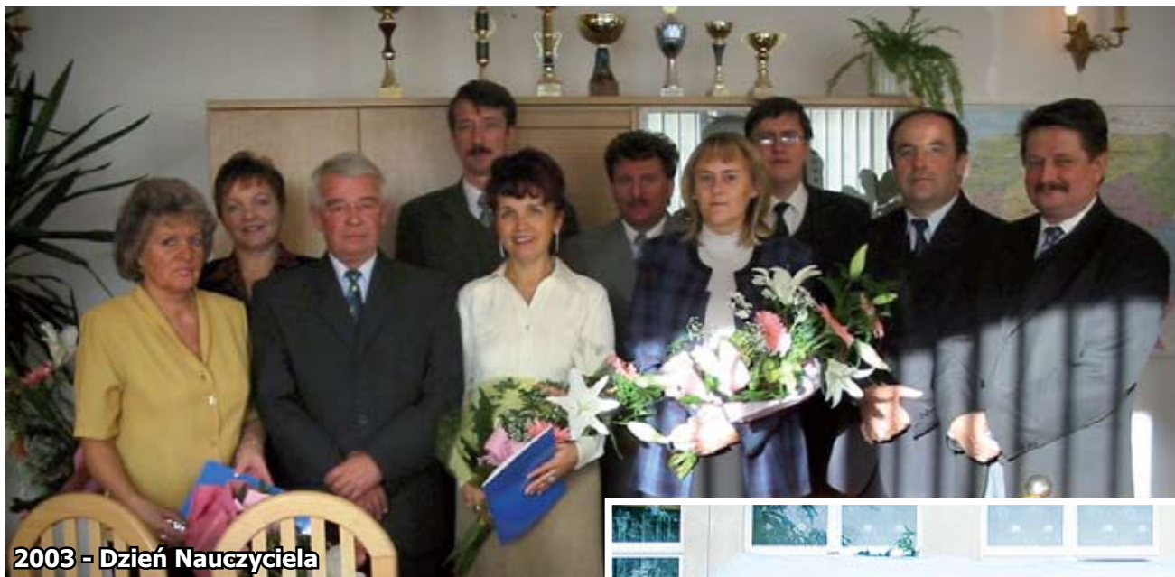
2003 - Dzień Nauczyciela