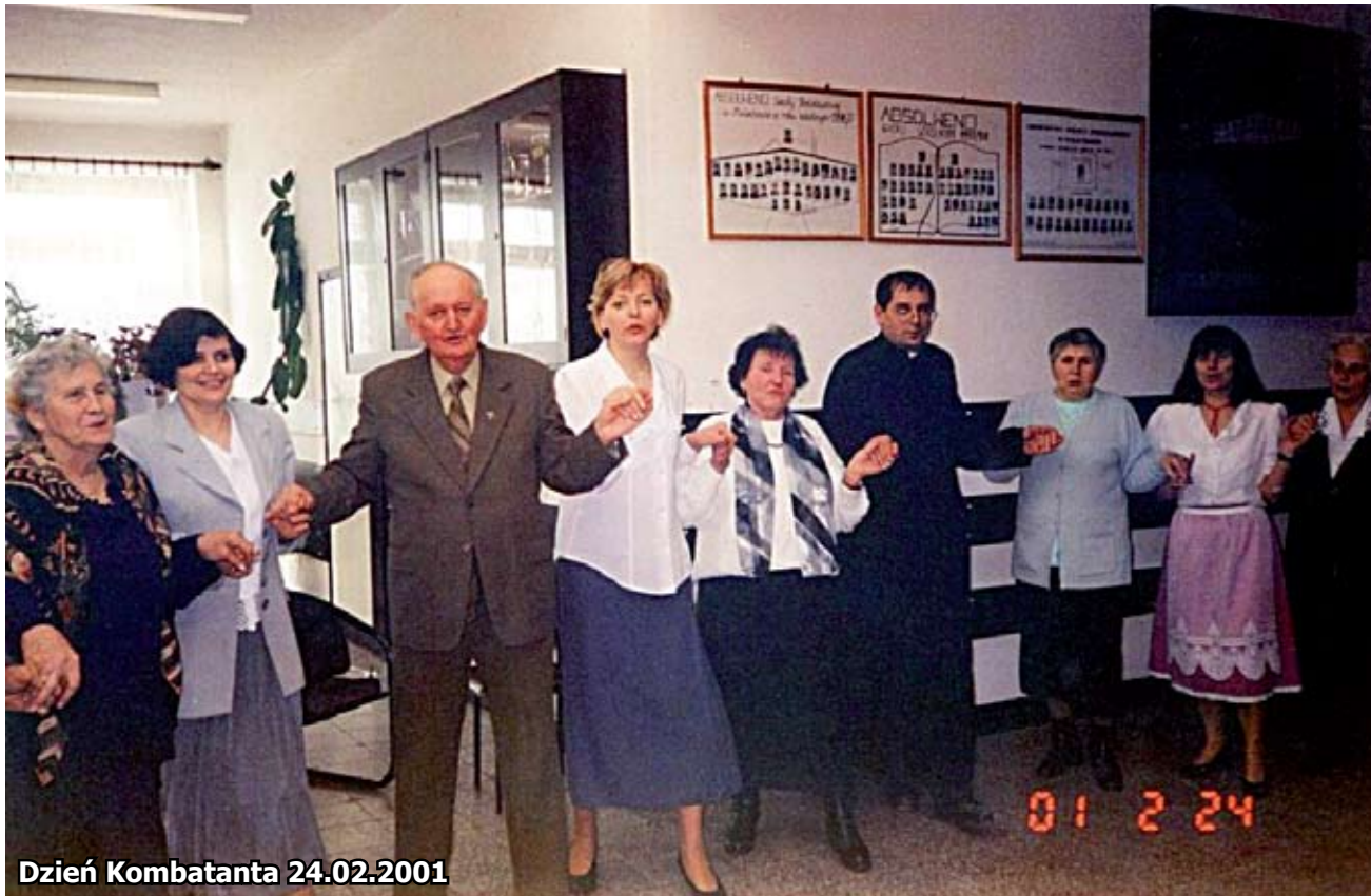
Dzień Kombatanta 24.02.2001