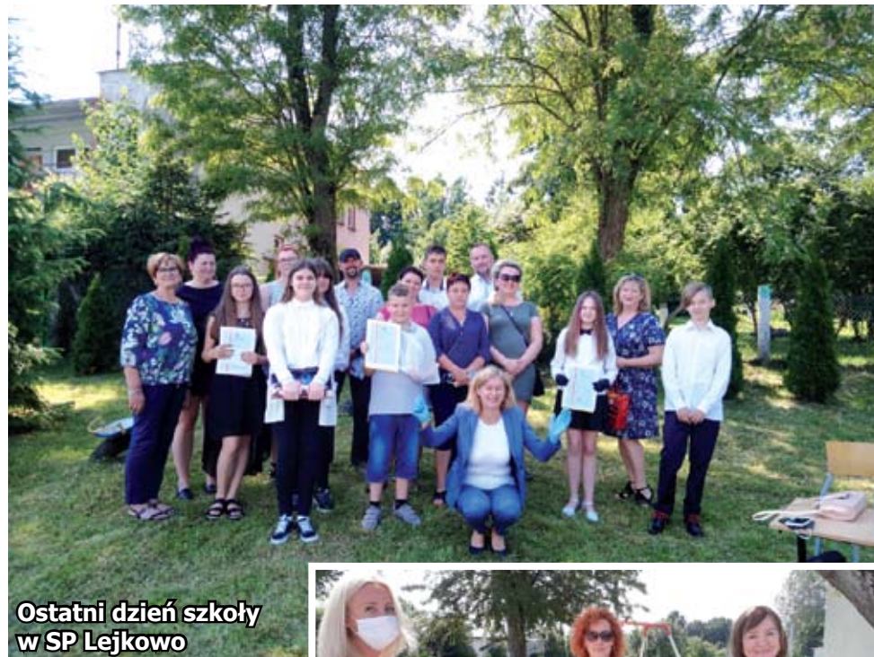
Ostatni dzień szkoły w SP Lejkowo

sistów oraz zerowiaków, gdyż nie miały formy, do której wszyscy jesteśmy przyzwyczajeni. Nauczyciele wszystkich naszych placówek zrobili jednak wszystko, by dzieci i młodzież kończący tak waż-