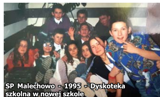
SP Malechowo - 1995 - Dyskoteka szkolna w nowej szkole