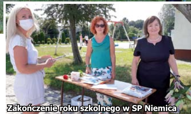
Zakończenie roku szkolnego w SP Niemica

ny etap w życiu czuły się wyjątkowo. Poniżej krótka fotorelacja z powitania wakacji. Już dziś życzymy bezpiecznych, pełnych przygód wakacji i powrotu do szkoły, za którą wszyscy zdążyliśmy zatęsknić.