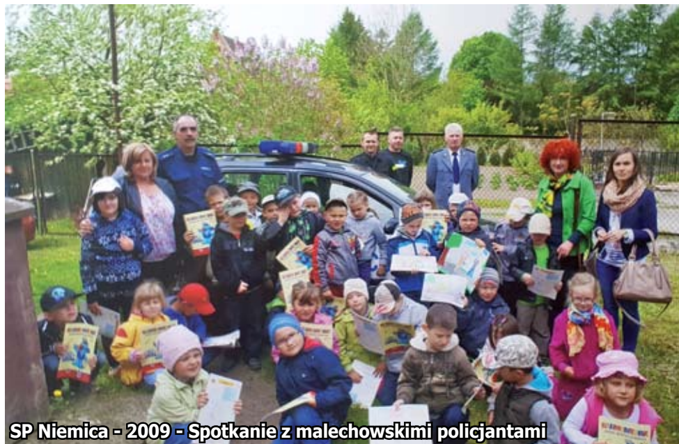
SP Niemica - 2009 - Spotkanie z malechowskimi policjantami