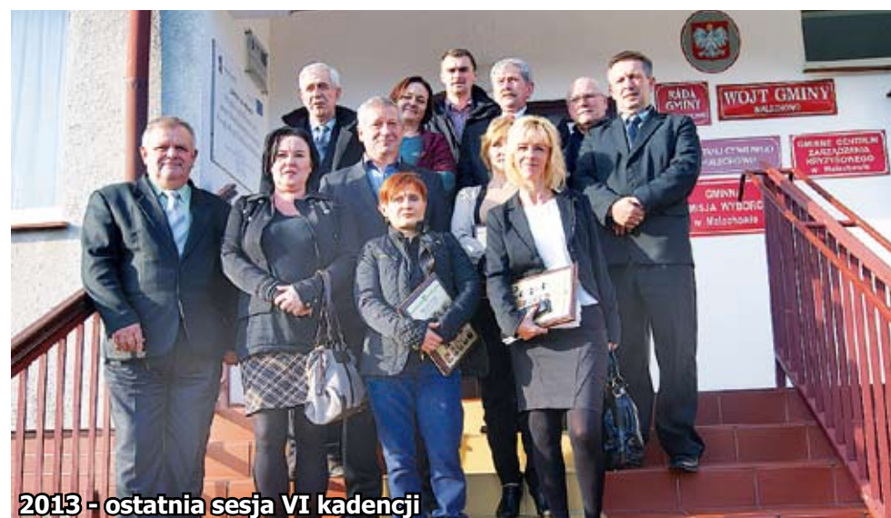
2013 - ostatnia sesja VI kadencji