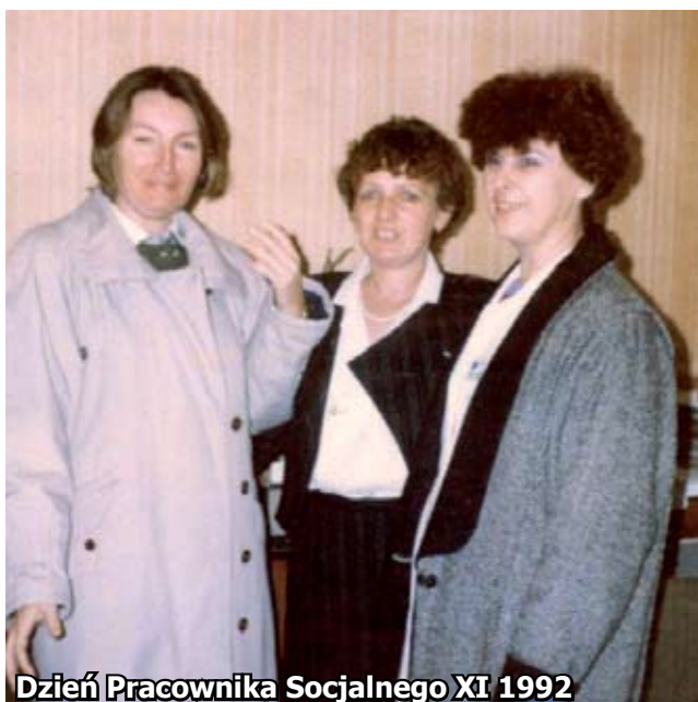
Dzień Pracownika Socjalnego XI 1992