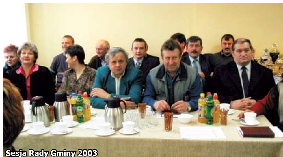
Sesja Rady Gminy 2003

zleconych. Niech to 30-lecie będzie przyczynkiem do wspomnień i sięgnięcia pamięcią do minionych lat... A jest co wspominać.