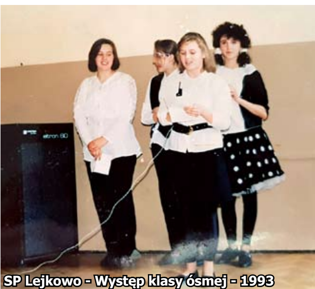
SP Lejkowo - Występ klasy ósmej - 1993