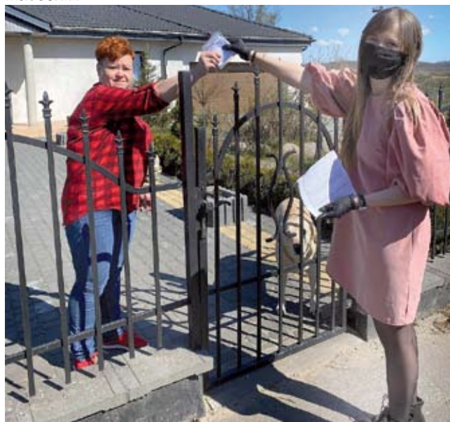
Maseczki dostarczali też pracownicy malechowskiego urzędu.

Wszyscy mieszkańcy naszej gminy wyposażeni zostali w maseczki ochronne wielokrotnego użytku. Dzięki wielkiej pracy sołtysów, radnych, wolontariuszy oraz dzięki uprzejmości właścicieli sklepów udało nam się rozdysponować 3,5 tysiąca maseczek. Wcześniej - w pierwszej turze - przekazaliśmy 2 tysiące sztuk.