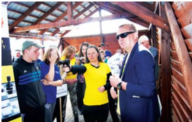
Strzelali radni i sołtysi

III Turniej Sołectw „Potyczki Sołeckie” odbył się na boisku wiejskim w Malechówku.