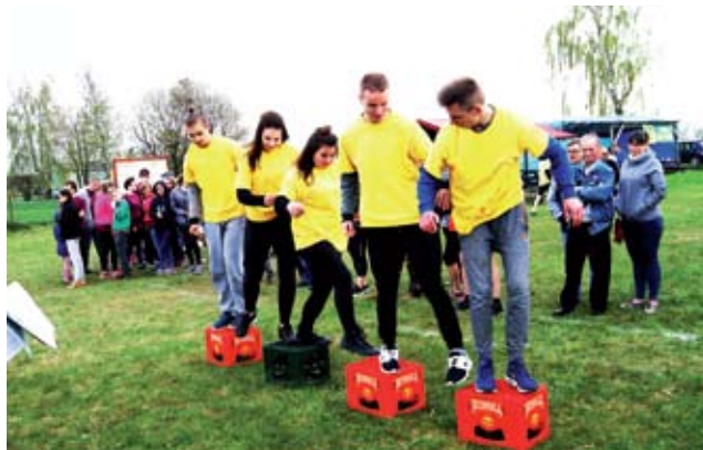
Sołecka gąsienica spodobała się publiczności.