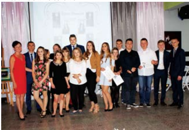
Zakończenie klas trzecich w Gimnazjum w Malechowie