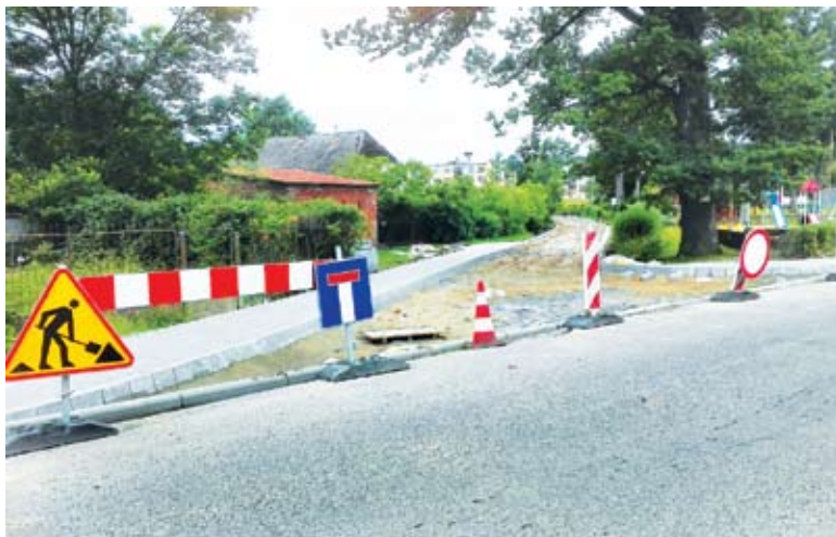
Przebudowa drogi w Karwicach