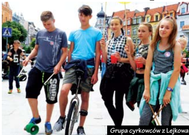
Grupa cyrkowców z Lejkowa

ry „Animatorzy” obejrzano spektakl sztukmistrzów z Lublina pt. „Spektrum”. Spotkaniom cyrkowym towarzyszyły pokazy, barwne parady ulicami miasta i warsztaty: żonglerki, iluzji, akrobatyki, poi, diabolo, szrudlarskie i inne. Dzieci doskonaliły