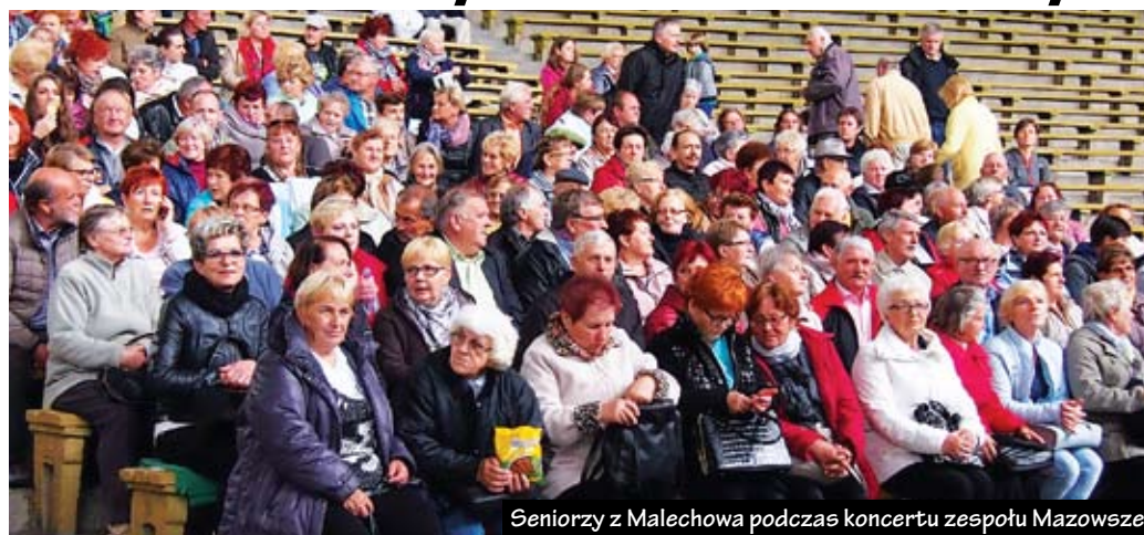
Seniorzy z Malechowa podczas koncertu zespołu Mazowsze

Zgodnie z założeniami projektu do realizacji zadania zakwalifikowało się 160 osób, w tym 10 znalazło się na liście