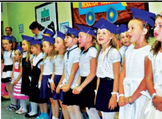
Przedszkole w Malechowie

W piątek, 23 czerwca odbyły się uroczyste apele z okazji zakończenia roku szkolnego. Uczestniczyli w nich uczniowie, nauczyciele, rodzice, zaproszeni goście i przedstawiciele władzy samorządowej. Poniżej krótka fotorelacja.