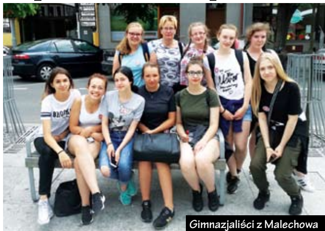
Gimnazjaliści z Malechowa

W dniach 16 – 17 czerwca br. dzieci i młodzież z naszej gminy uczestniczyła w XVIII Ogólnopolskich spotkaniach cyrkowych w Brodnicy.