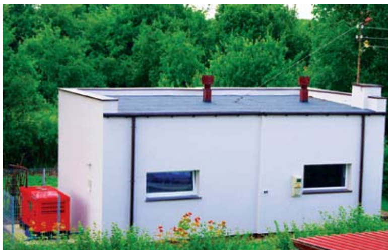
Remont hydroforni w Malechowie

Zakładane jest utworzenie funkcjonalnych sal dla 4 oddziałów przedszkolnych wraz z zapleczem sanitarnym,