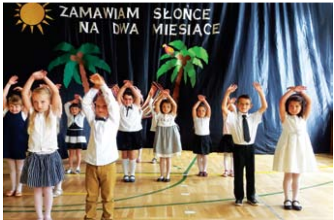
Przedszkole w Ostrowcu