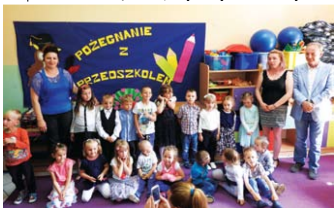
Przedszkole w Kusicach