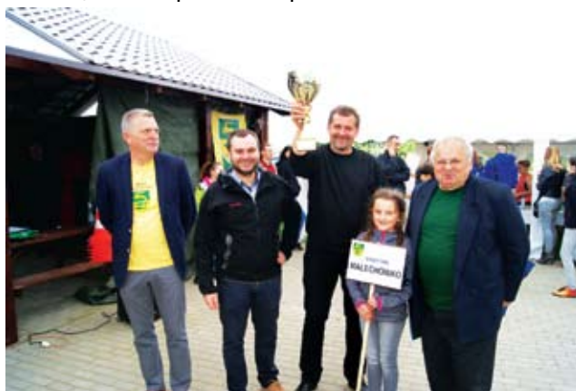
Zwycięzcy Potyczek - Sołectwo Malechówko Malechówko, które wywalczyło nagrodę pieniężną w wy-

sokości 500 zł (i będzie gospodarzem turnieju w przyszłym roku).