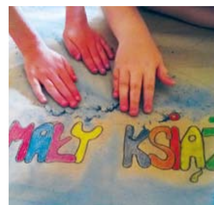
Wspomnienie wyjazdu do Multikina w Koszalinie