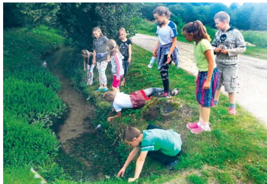
Wyprawy do lasu i po okolicy Święcianowo