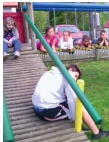
Beztróski czas w placówce w Przystawach