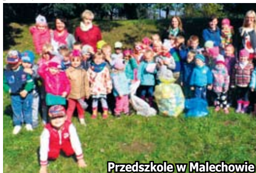
Przedszkole w Malechowie

obcy. Trzeba przyznać, że śmieci jest na szczęście coraz mniej. Dawniej napełnienie kilku worków nie stanowiło problemu, obecnie dzieci wręcz współzawodniczyły, aby odnaleźć porzucony śmieć. Cieszy nas ogromnie, że z roku na rok jest coraz lepiej. Efekty tych działań ponizej.