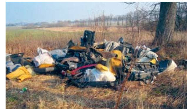
Zlikwidowali 9 „dzikich” wysypisk śmieci oraz 63 miejsca nielegalnego pozbywania się odpadów

Malechowska straż działa dobrze. Najlepiej świadczy o tym wynik kontroli przeprowadzonej w 2013 r. przez Policję. W protokole pokontrolnym nie stwierdzono żadnych uchybień.