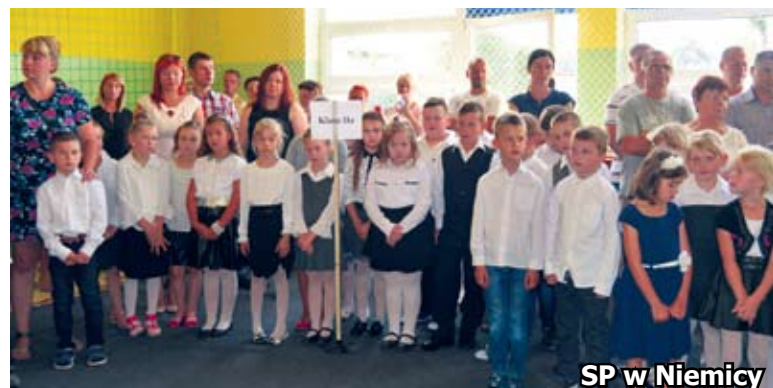
SP w Niemicy