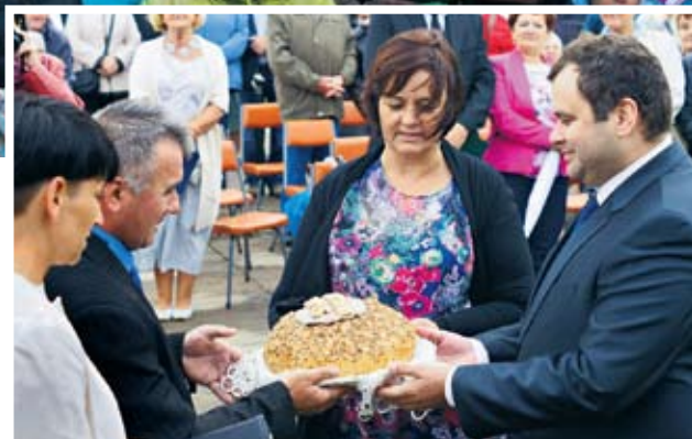
Zgodnie z tradycją władze gminy dzieliły się chlebem z mieszkańcami