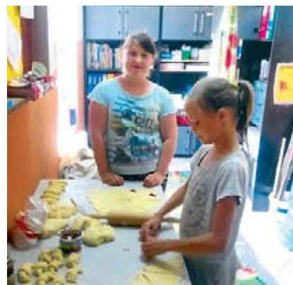
Tradycyjne warsztaty kulinarne w Kusicach

Kawiarenka placówek wsparcia dziennego na dożynkach gminnych w Grabowie oferowała kawę i ciasta upieczone przez dzieci na warsztatach kulinarnych oraz przez zaprzyjaźnionych rodziców.