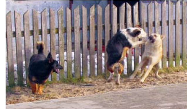
Strażnicy uczestniczyli wspólnie z lekarzem weterynarii w wyłapaniu 141 bezdomnych psów