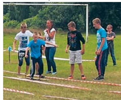
Piknik Rodzinny na rozpoczęcie wakacji