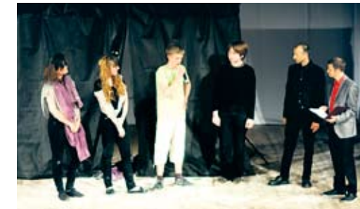
Przedstawienie z koszalińską młodzieżą w BTD z okazji Międzynarodowego Dnia Zapobiegania Narkomanii. Czerwiec 2013 r.