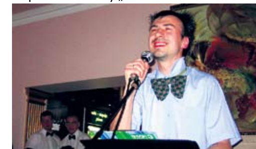
Występ kabaretowy w Restauracji „Stary Młyn” w Świdwinie w 2005 roku. Piosenka o komarze