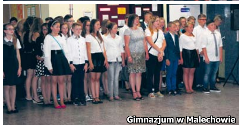
Gimnazjum w Malechowie