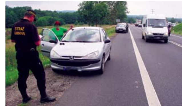
414 kontrole w ruchu drogowym zakończyły się nałożeniem mandatów na łączną kwotę 1.164.195 zł