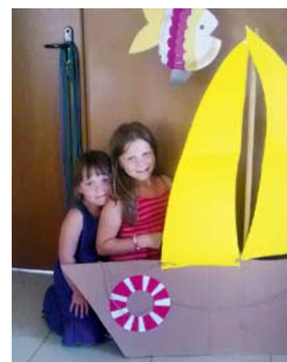
Warsztaty plastyczne w Kosierzewie