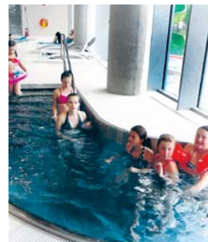
Zakończenie wakacji w parku wodnym w Koszalinie