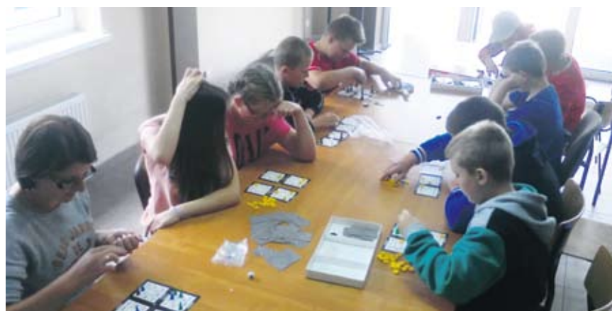
Ćwiczenie umysłu w Sulechowie

Także młodzież korzystająca z oferty Gminnej Biblioteki Publicznej w Malechowie nie mogła narzekać na brak zajęć. Organizowane były rozgrywki z wykorzystaniem gier planszowych i gier edukacyjnych. Rywalizowano m.in. w rozgrywkach warcabowych, Chińczyku, Małym detektywie czy też Asach przestworzy. Młodsze dzieci uczestniczyły w zajęciach plastycznych, tworząc kolorowe ilustracje oraz wspaniały, papierowe ozdoby. Czas wakacji w gminie Malechowo minął dzieciom bardzo szybko, ale najważniejsze jest to, że spędzone one zostały pożytecznie.