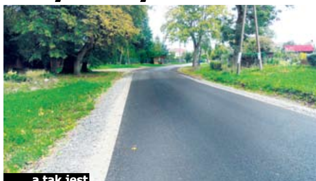
... a tak jest

W sierpniu zmieniło się oblicze drogi na trasie Gorzyca – Przystawy. Remont objął wymianę nawierzchni oraz usypanie poboczy. Dzięki temu wzrosło bezpieczeństwo mieszkańców poruszających się po drodze i wzrósł tym samym ich komfort.