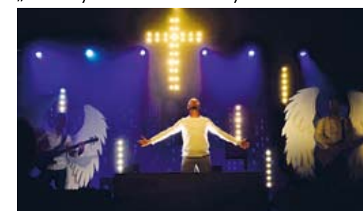
„Jezus - reaktywacja” w Kościele „Woda Życia”. Nowatorski spektakl o śmierci i zmartwychwstaniu. 06.2015 r.