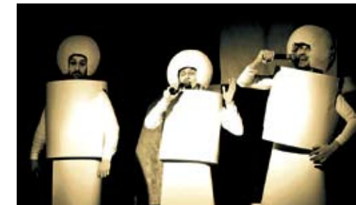
„Żywoł pionka” - występ kabaretowy w kościele „Woda Życia” w Koszalinie. Sylwester 2011 r.