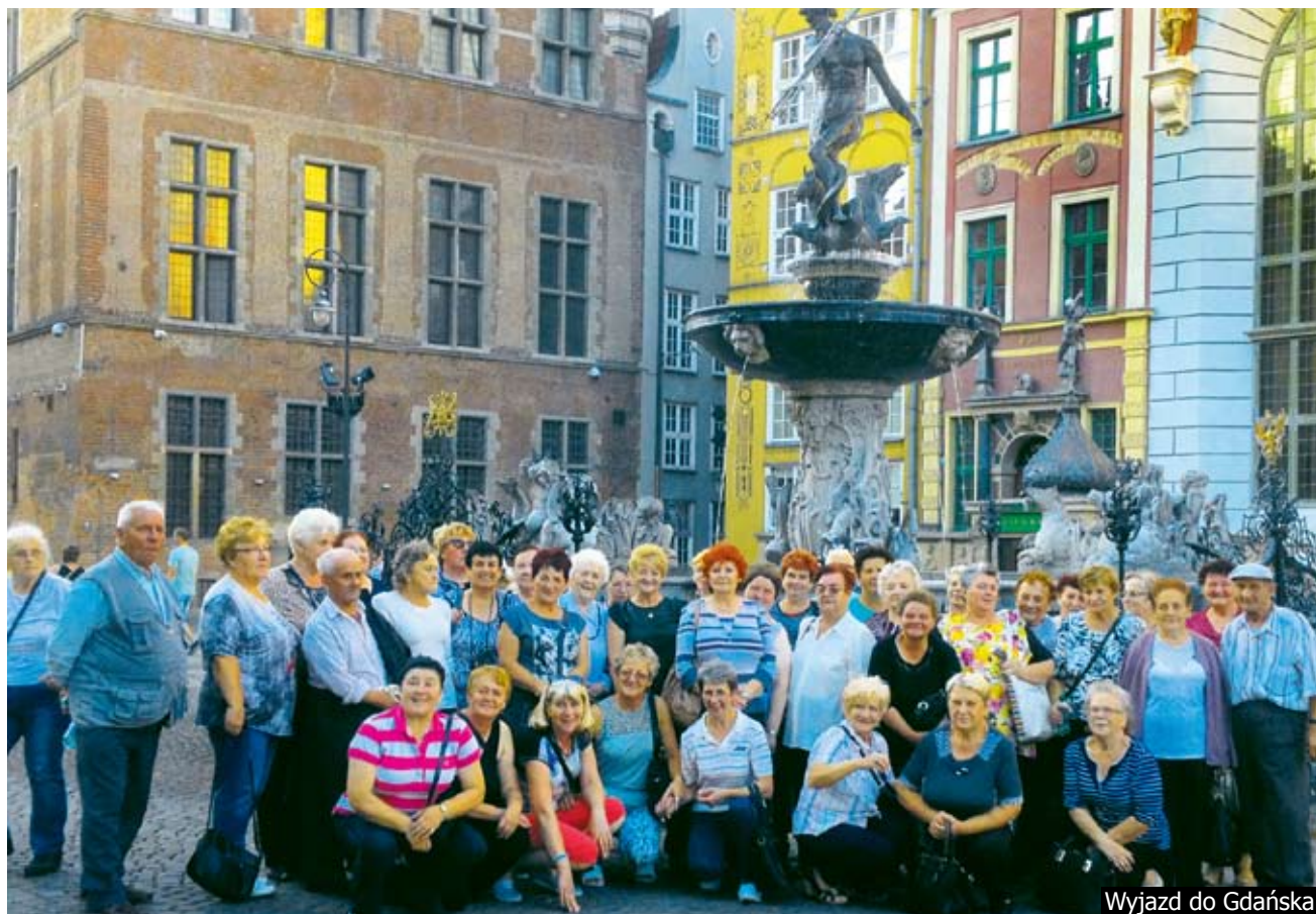
Wyjazd do Gdańska

Starsze pokolenia naszych mieszkańców to grupa społeczna, która zawsze była aktywna, wychowana w czasach, kiedy ludzie byli bliżej siebie, częściej się spotykali, częściej robili coś wspólnie i chyba tego im brakowało w obecnych czasach telewizji i komputerów.