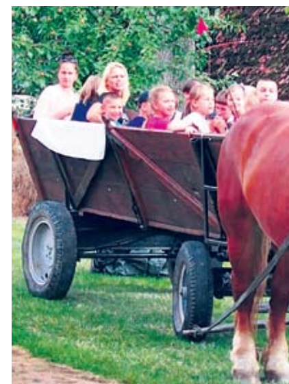
Swołowo – Kraina w kratę