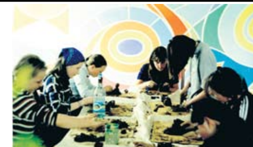
Młodzież na zajęciach „Działania Pozytywne”, które prowadziłem w 2001 roku w Ośrodku Wspierania Rodziny „Szansa” w Malechowie

Kontakt: tel. 512 438 014. Moje prace artystyczne obejrzeć można na stronie: www.facebook.com/art.rem0 . Zapraszam też na stronę mojej firmy, która świadczy usługi reklamowe: www.facebook.com/studio.remart