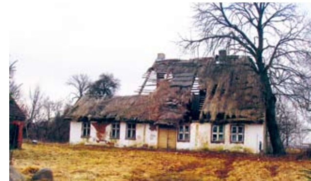
Spowodowali wydanie 16 decyzji o rozbiórce bądź zabezpieczeniu zrujnowanych budynków.