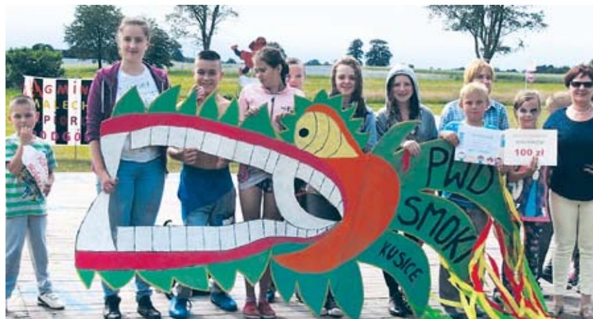
I nagroda za wykonanie baneru dla placówki w Kusicach