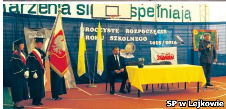
SP w Lejkowie

Nowy rok szkolny niesie za sobą nowe wyzwania i ambitne plany. Uczniowie pożegnali czas swobody, letnich spacerów, oddechów przyrody i niesamowitych przygód.