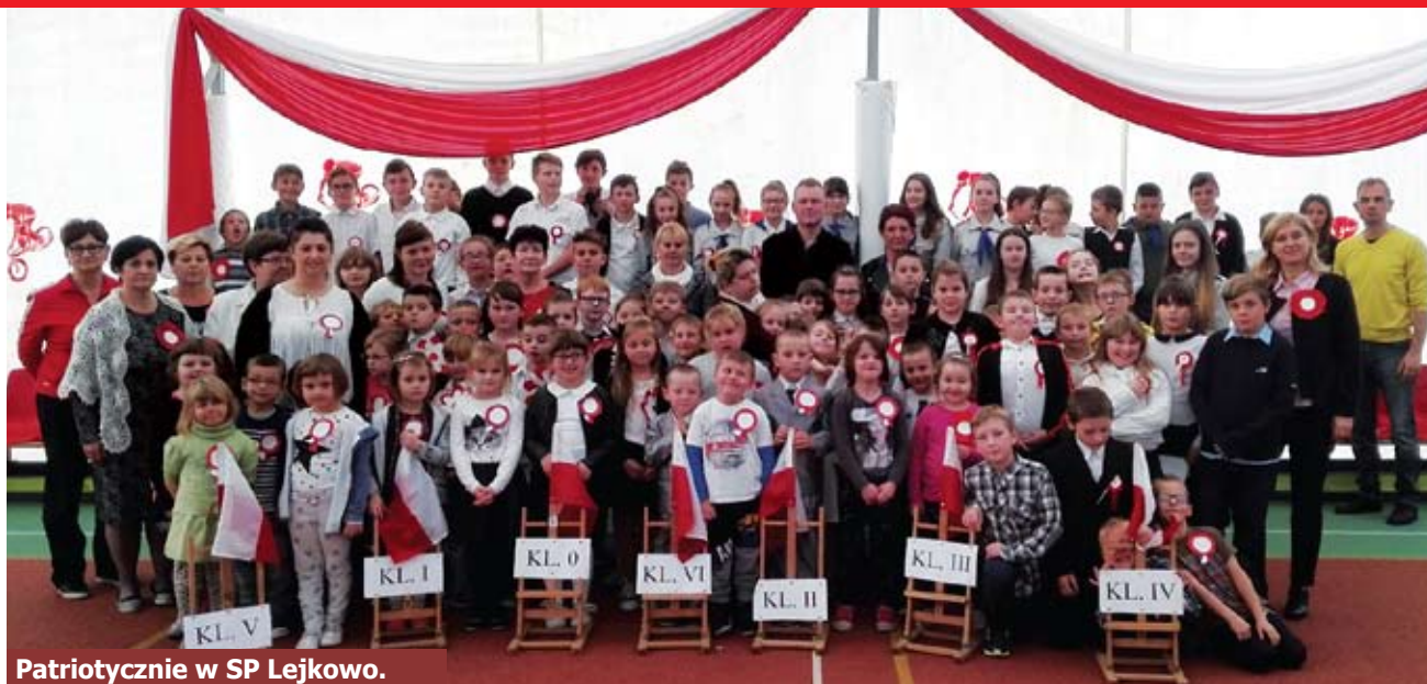
Patriotycznie w SP Lejkowo.