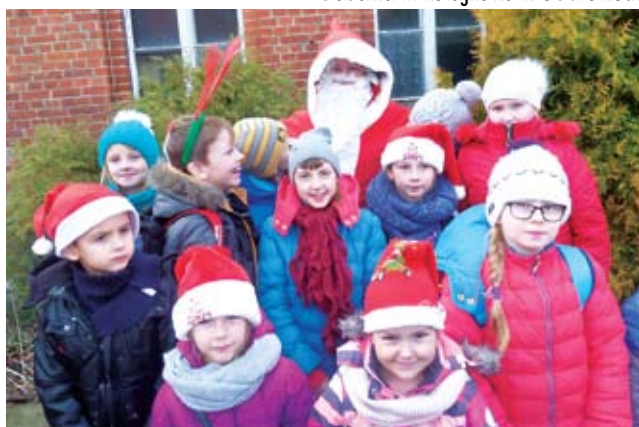
Radość dzieci w Karwicach.

Magiczny czas Mikołajek to wyczekiwanie na pierwszą wizytę Świętego Mikołaja i oczekiwanie na słodkości.