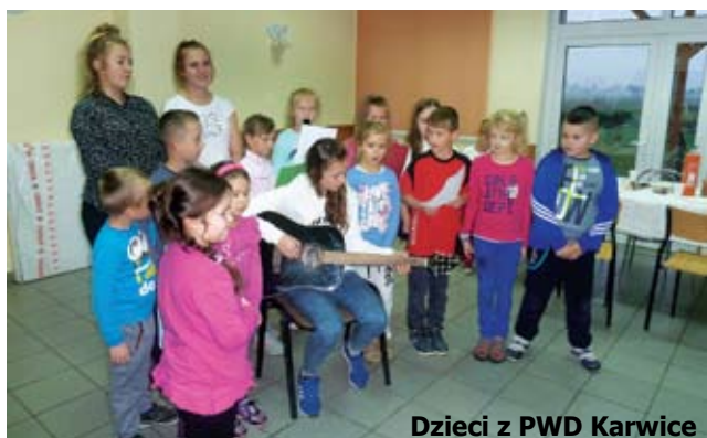
Dzieci z PWD Karwice