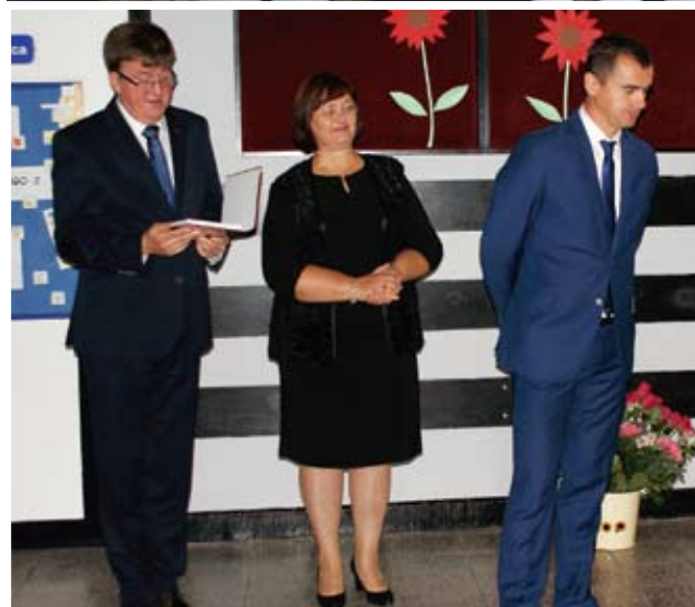
Apel w Gimnazjum w Malechowie.

Bycie nauczycielem to profesja trudna, odpowiedzialna i wymagająca, ale także piękna. Kształtowanie charakterów młodych ludzi i przekazywanie im wiedzy daje z pewnością ogromną satysfakcję.