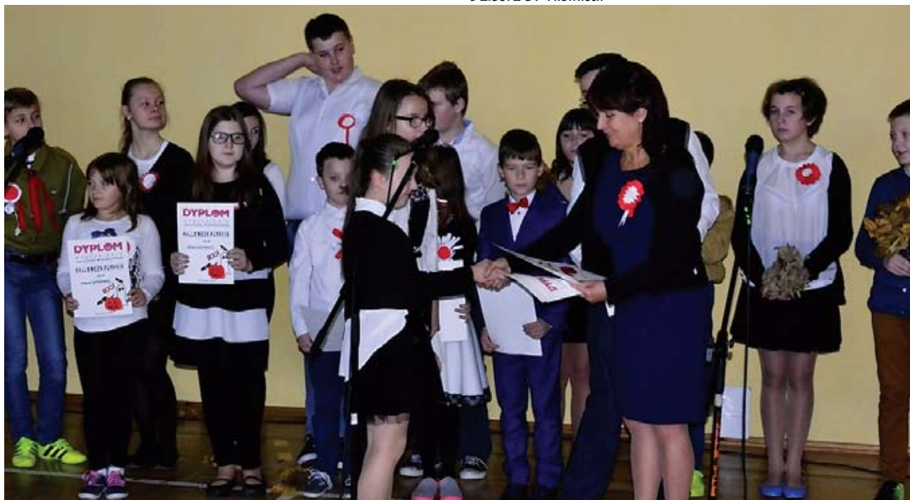
Uroczysty apel w ZS Ostrowiec.