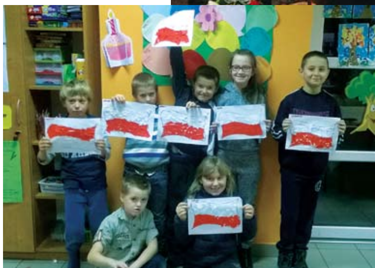
Dzieci z PWD Laski