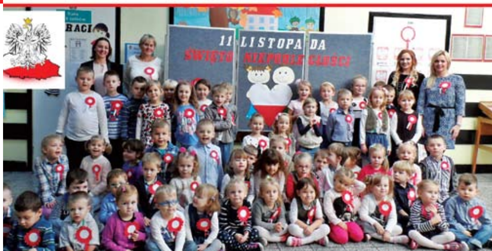
Przedszkolaki z Malechowa.

„Dziękujemy za piękne przedstawienie, cieszymy się, że trudna historia naszego kraju jest Wam znana, Polska to Wy, patriotyzm to Wy, to młodzi ludzie” - można było usłyszeć z ich ust. Uroczyste spotkanie w ma-