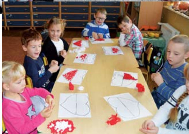
Dzieci z SP Niemica.