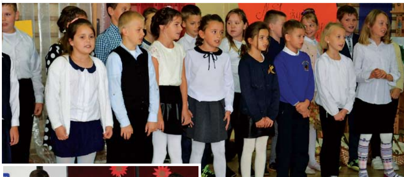
Uczniowie ze Szkoły Podstawowej w Niemicy.