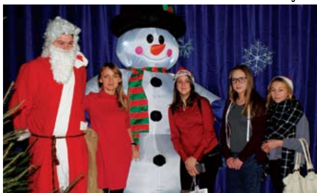
...i w Gimnazjum w Malechowie.