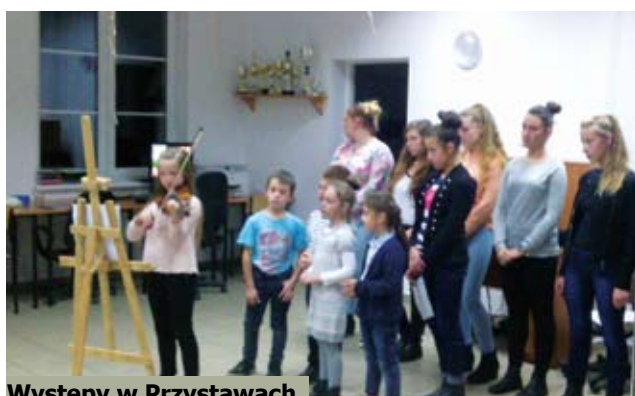
Występy w Przystawach.

– seniorów do wspólnej zabawy. Dzieci zadały sobie wiele trudu, aby ugościć seniorów. Pod okiem wychowawczyń przygotowały smakowite wypieki, dekorowały sale, urządziły akademie, koncerty, wspól-