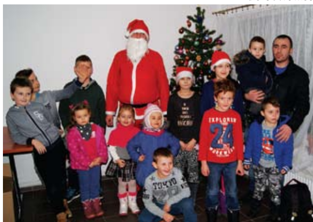
Wizyta Mikołaja w Niemicy...