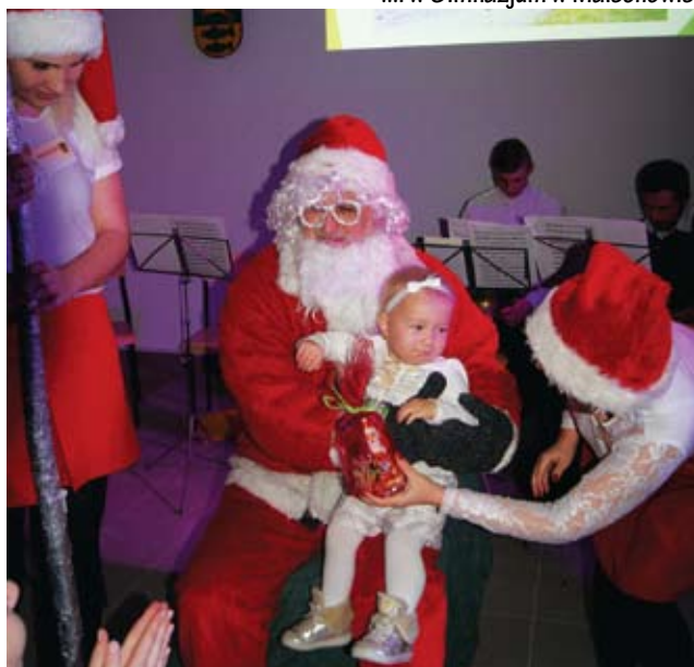
Niespodzianka podczas otwarcia Domu Wiejskiego w Gorzycy.