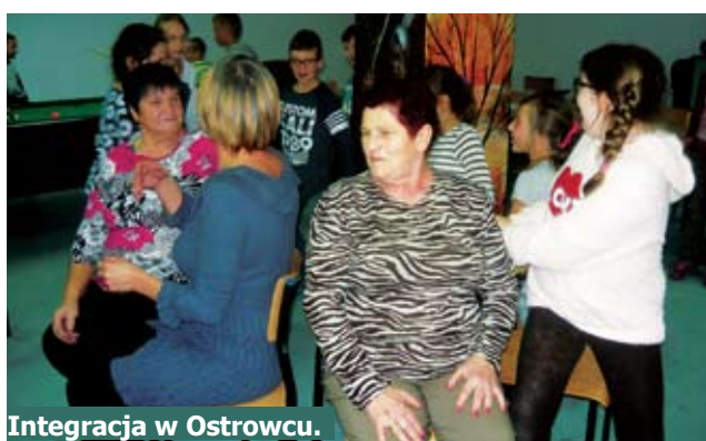
Integracja w Ostrowcu.