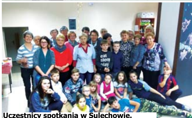
Uczestnicy spotkania w Sulechowie.

Jacy są seniorzy w naszej gminie? Kreatywni, energiczni, mający zapał do działania i mnóstwo pomysłów.