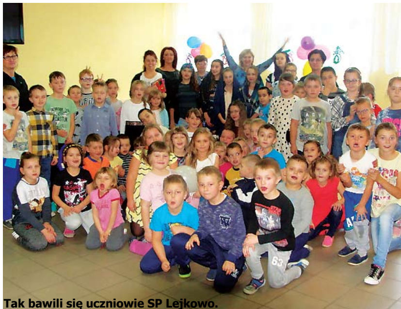
Tak bawili się uczniowie SP Lejkowo.

Oczekiwanie na Święta Bożego Narodzenia to kilkutygodniowy okres adwentu.