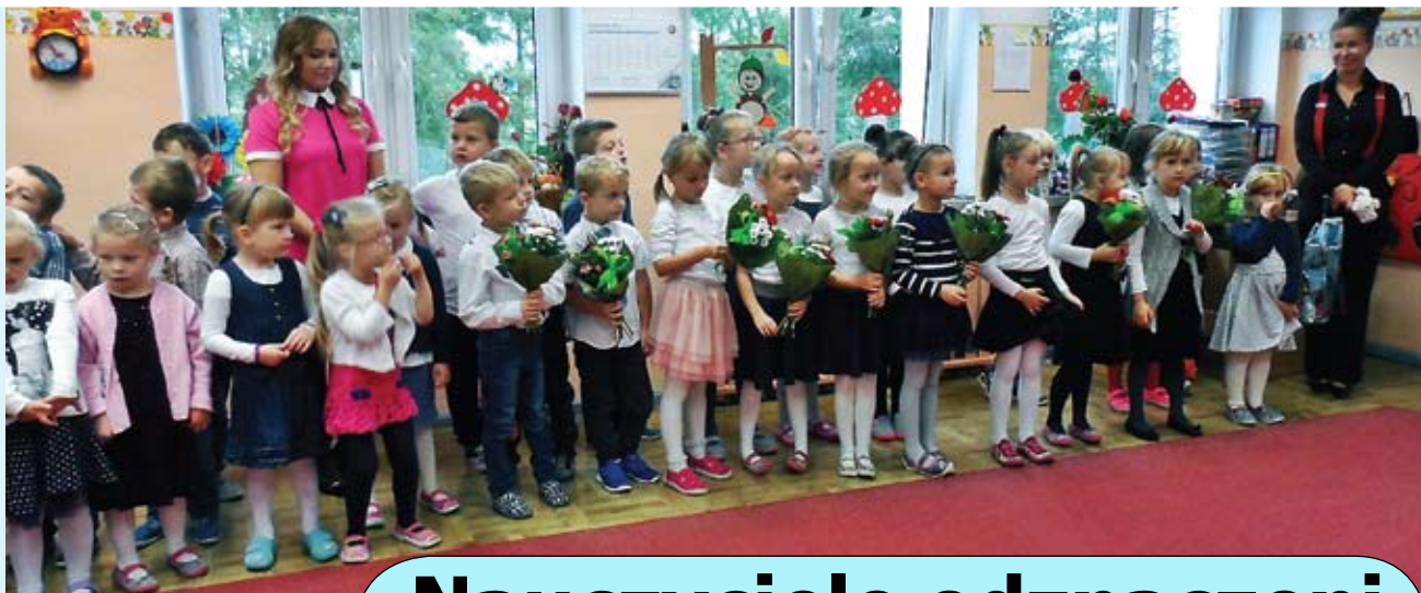
Uroczyste dzieci z Przedszkola w Malechowie.