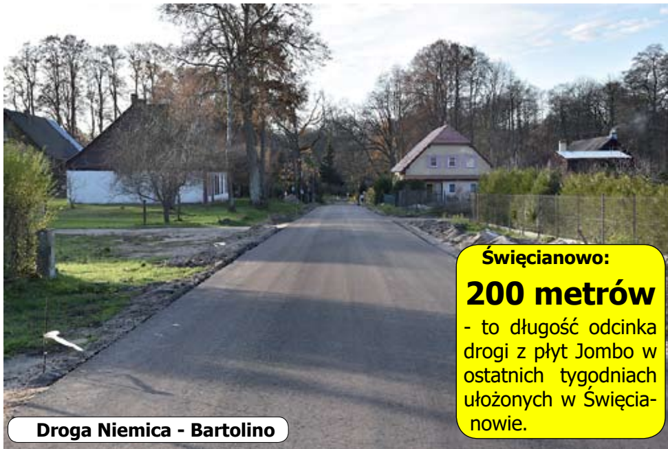
Droga Niemica - Bartolino