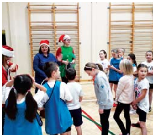
Śnieżynki w SP Niemica