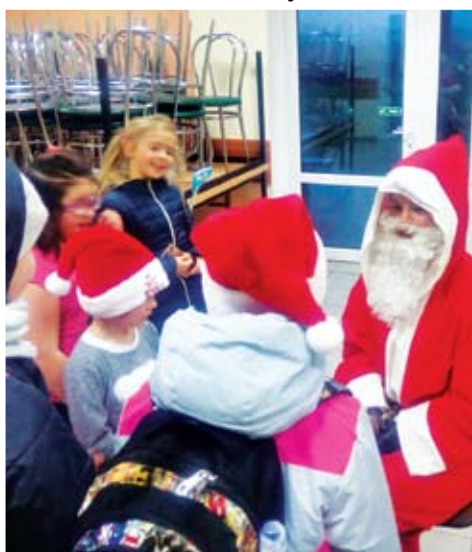
Dzieci z PWD Karwice witają Mikołaja