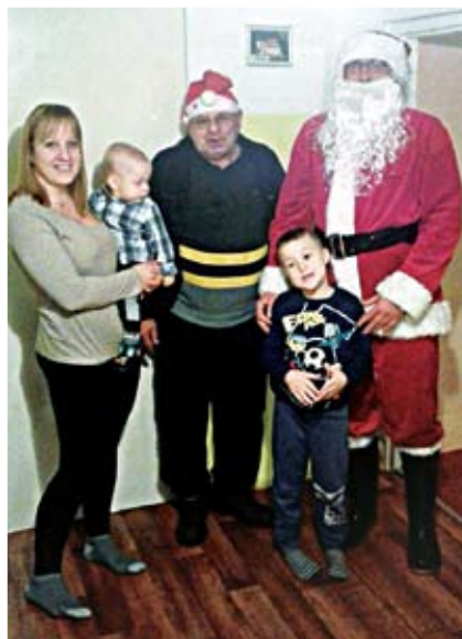
Odwiedziny w Malechówku