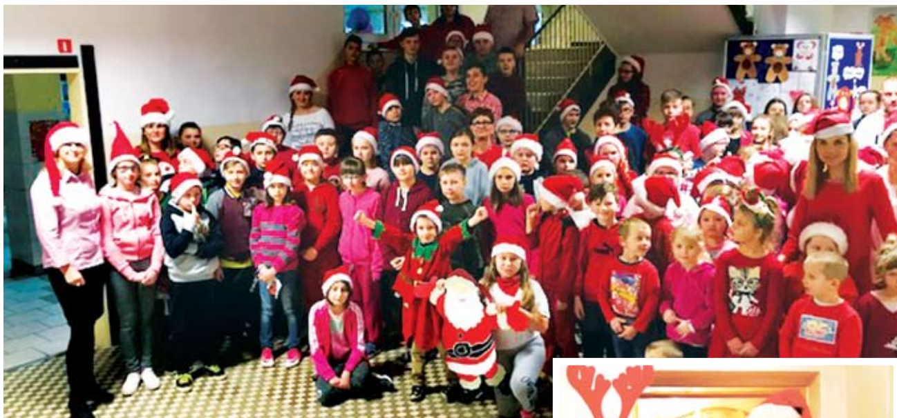
Szkoła Podstawowa w Lejkowie

6 grudnia to niezapomniany dzień zarówno dla dzieci jak i dorosłych.