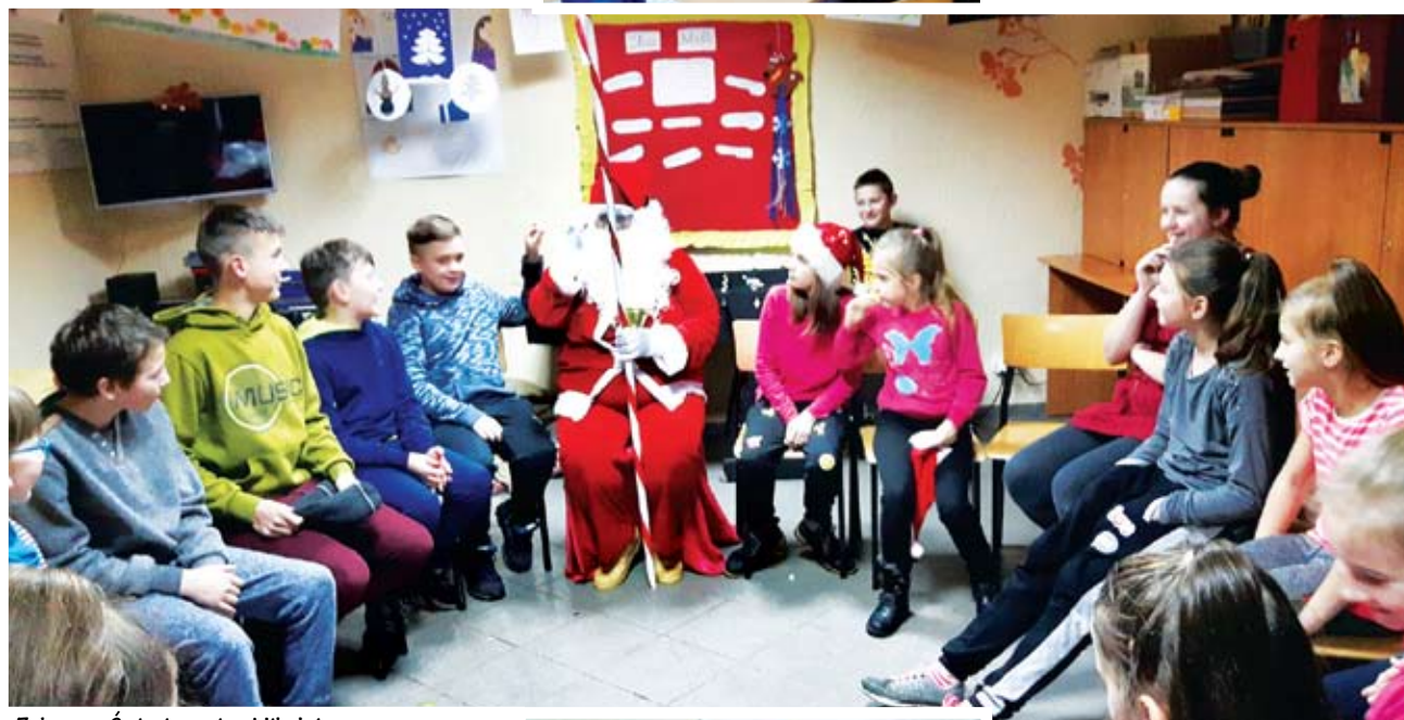
Zabawa w Świącianowie z Mikołajem