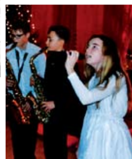
Muzycy z SP Niemica