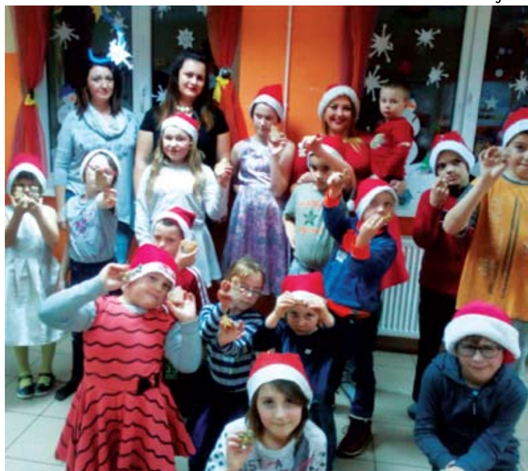
Placówka Wsparcia Dziennego Laski