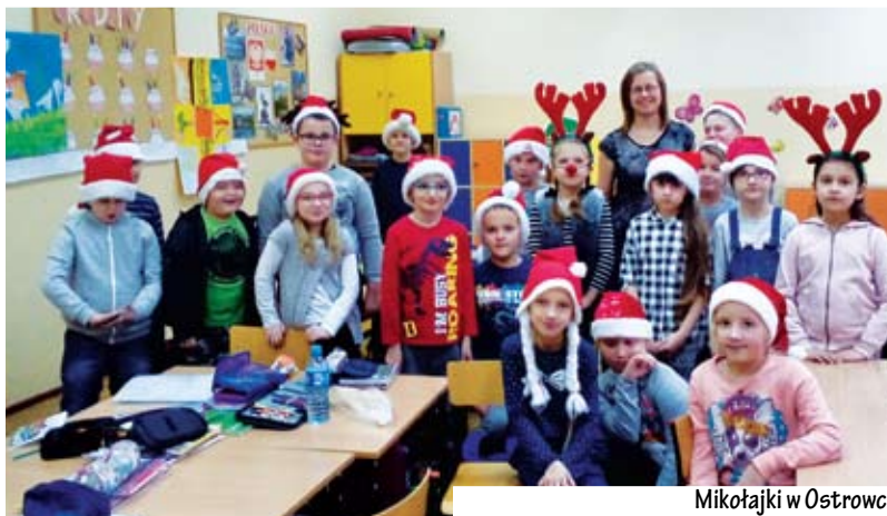
Mikołajki w Ostrowcu