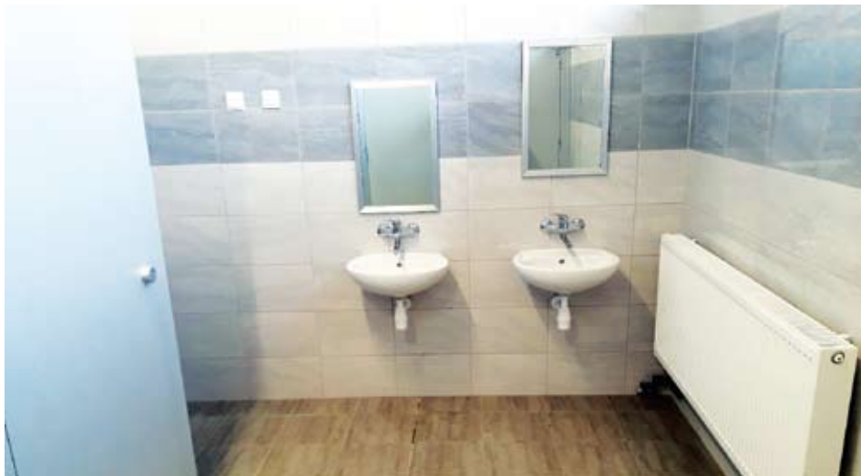
Wyremontowane toalety w SP Malechowo

modernizowano podłogi, wprowadzano nowoczesne i ekonomiczne rozwiązania.