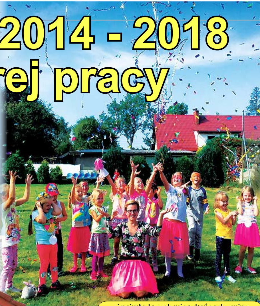
... i najmłodszych mieszkańcach gminy.