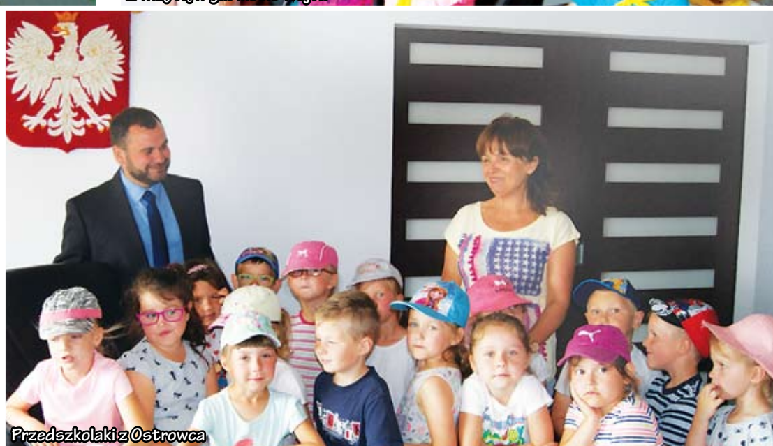
Przedszkolaki z Ostrowca