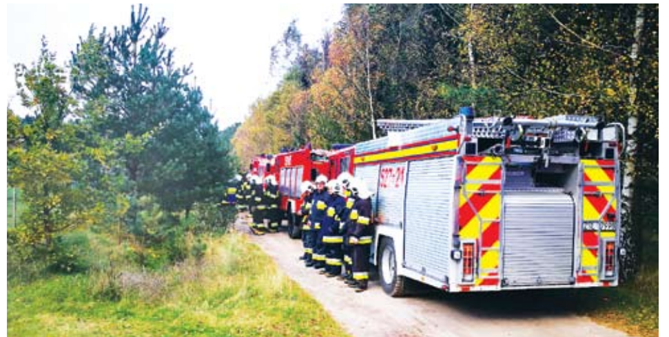
Strażacy z terenu Gminy są cyklicznie szkoleni

dem Gminy, ze szkołami, radami sołeckimi i stowarzyszeniami. Regularnie przygotowują pogadanki w szkołach, przedszkolach i pokazy