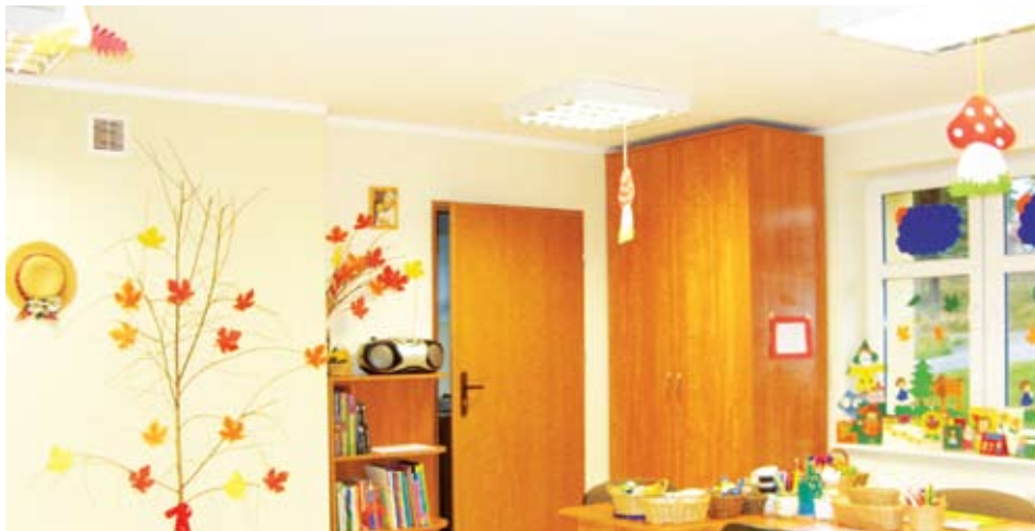
Świetlica w Kosierzewie

tach, ale to też cieszy, gdyż okazuje się funkcjonowanie świetlic wiejskich w naszej gminie jest zasadne.