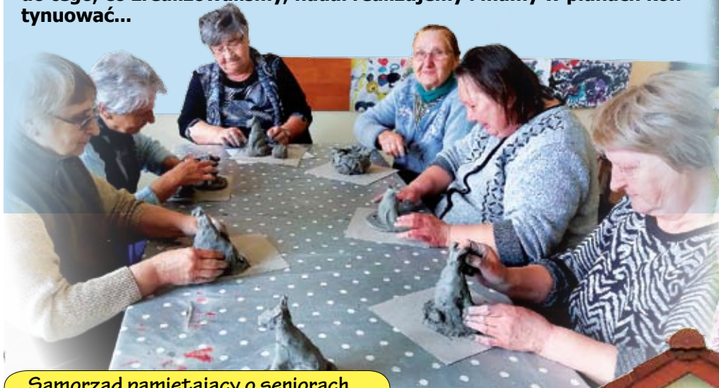
Samorząd pamiętający o seniorach...