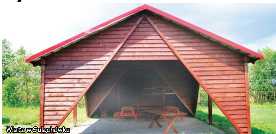
Wiaty w Sulechówku

Budowa nowych wiat rekreacyjnych to odpowiedź malechowskiego samorządu na potrzeby mieszkańców dotyczące stworzenia miejsc integracji. Ze względu na to solidne, drewniane wiaty pojawiły się w Bartolinie, Malechówku, Sęczkowie oraz w Sulechówku.