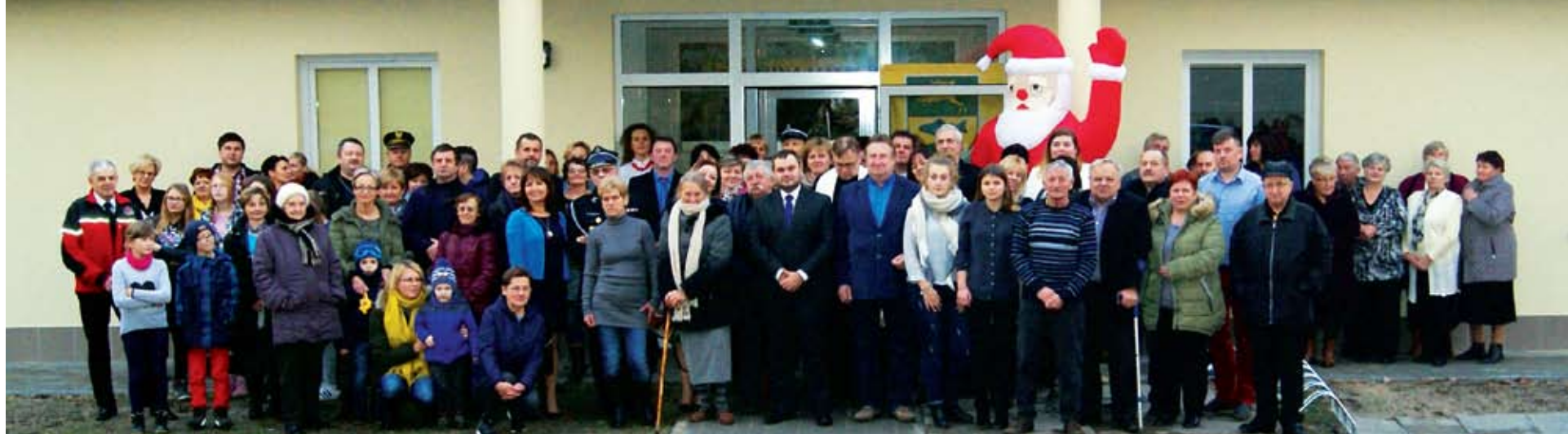
Samorząd inwestujący w potrzeby mieszkańców!