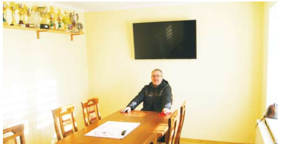
Nowa świetlica w OSP Malechowo

Całkowity koszt zakupu to 338 146,92 zł.