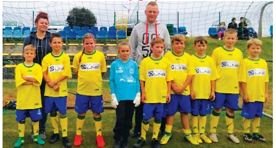
UKS GRABOWA - SP Lejkowo

W latach 2015 - 2017 malechowski samorząd przekazał łącznie 55 tys. zł na funkcjonowanie uczniowskich klubów sportowych i promowanie zdrowych postaw sportowych wśród dzieci oraz młodzieży.