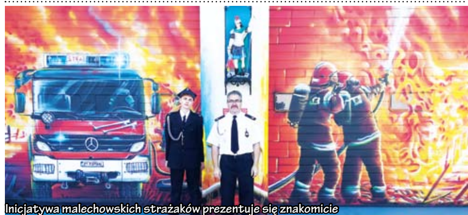
Inicjatywa malechowskich strażaków prezentuje się znakomicie

na sprawność młodych ludzi, którzy z czasem będą stanowić trzon zastępów OSP Gminy Malechowo.