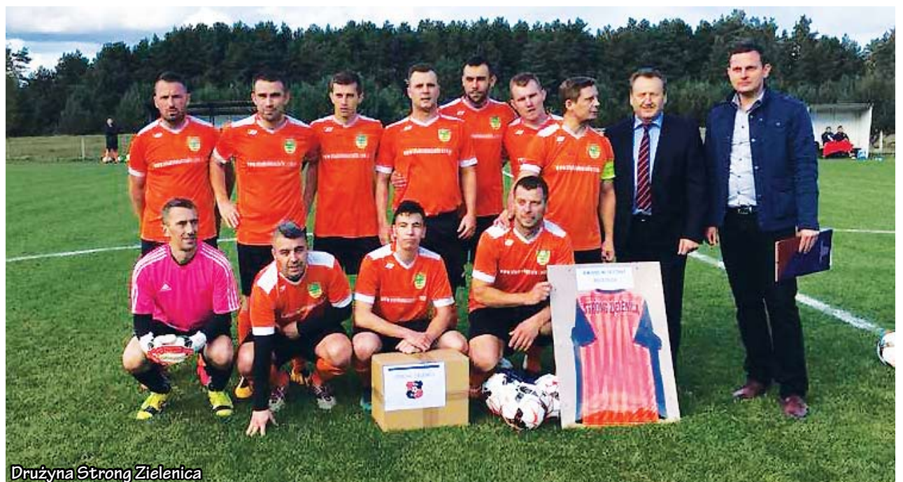
Drużyna Strong Zielenica

Zadania, jakie wykonywały Arkadia Malechowo i Strong Zielenica to upowszechnianie kultury fizycznej poprzez prowadzenie zespołów piłkarskich, kreowanie postaw prozdrowotnych oraz oczywiście promocja naszego regionu.