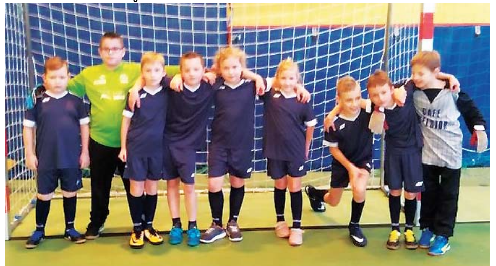
UKS Pomerania Ostrowiec