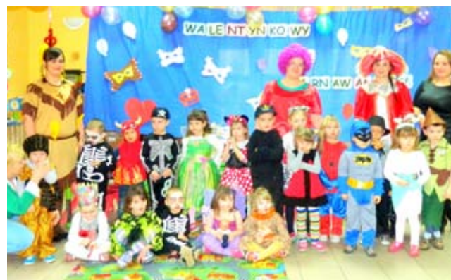
Punkt przedszkolny w Laskach