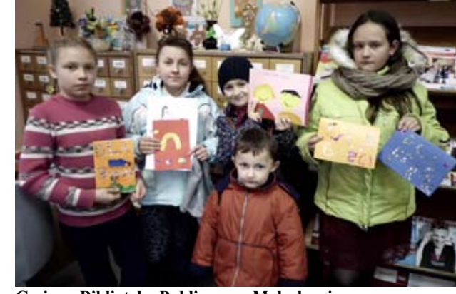
Gminna Biblioteka Publiczna w Malechowie