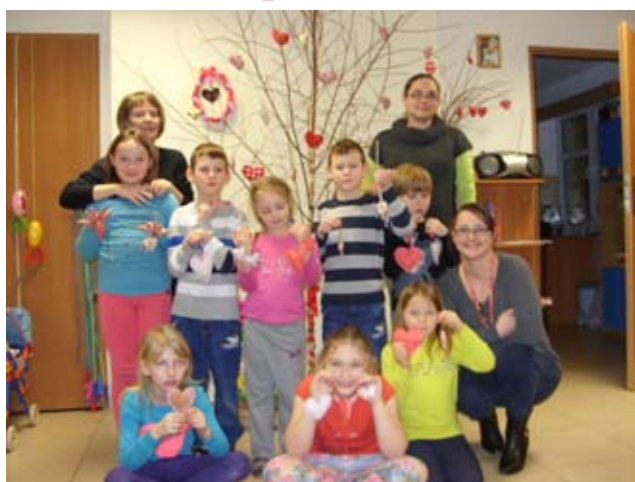
Placówka Wsparcia Dziennego Kosierzewo

Mimo, że krytykanci tego „sztucznego” święta zarzucają naśladowanie amerykańskich wzorów, dla nas ten dzień może być doskonałym pretekstem do okazania miłości i szacunku drugiemu człowiekowi. Zoba-