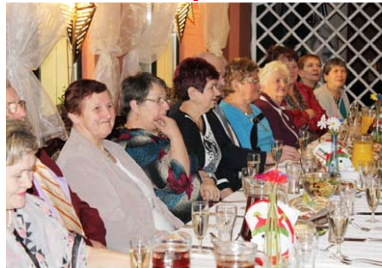
W pierwszym tegorocznym spotkaniu wzięli udział seniorzy z całej gminy

W restauracji „Pod Dębem” w Malechowie, odbyła się kolejna integracyjna impreza dla seniorów z gminy Malechowo.