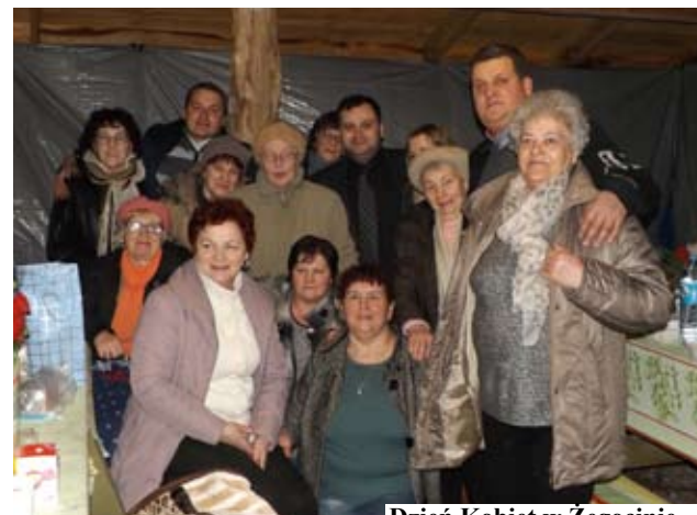
Dzień Kobiet w Żegocinie

Dzień Kobiet – przedstawicielki naszej gminy, świętowały jak zwykle wyjątkowo i w dobrym nastroju. Zarówno dojrzałe panie jak i dziewczynki z oddziałów przedszkolnych oraz szkół podstawowych, a także dziewczęta z malechowskiego gimnazjum i placówek wsparcia dziennego działających na terenie gminy tych dzień będą długo pamiętać.