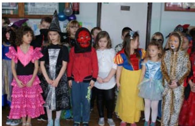
Zespół Szkół w Ostrowcu

Karnawał, po staropolsku zwany zapustami, to czas zliczony od Nowego Roku lub od Trzech Króli i trwający do Środy Popielcowej. Nazwa pochodzi od łacińsko-włoskiego "carnavale", czyli rozstania z mięsem, co w języku polskim tłumaczone jest na "mięsopest". Słowo "karnawał" nawiązuje także do łacińskiego "carrus navalis", jak w starożytnym Rzymie zwano łódź na kolach - ukwiecony rydwan boga Dionizosa, pojawiający się na rzymskich ulicach podczas hucznych obchodów powitania wiosny.