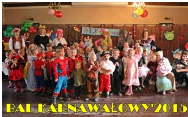
Przedszkole w Malechowie, Dworek Golikowo

Posumowaniem pracy w pierwszym półroczu w Przedszkolu oraz Szkole Podstawowej Zespołu Szkół im. M. Kopernika w Ostrowcu był bal karnawałowy, który rozpoczął korowód wspaniałe przebranych dzieci. Było na co popatrzeć – po prostu „kolorowy zawrót głowy”! Na szczególne podziękowanie za pomoc w organizacji tego wydarzenia zasługują harcerze 27 DH im. Jerzego Kukuczki i zuchy 3 GZ "Słoneczna Gromada" z Ostrowca. Druga część zabawy odbyła się w salach zabaw, gdzie zorganizowano dzieciom konkursy, zabawy oraz słodki poczęstunek.