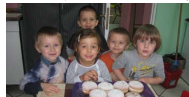
Przedszkole w Kusicach

Tłusty czwartek to ulubione święto mieszkańców naszej gminy, zarówno tych dużych jak i małych. Dzieci z Placówek Wsparcia Dziennego w Karwicach, Kosierzewie i Ostrowcu i maluchy z Przedszkola w Kusicach zjadały się pysznymi pączkami, faworkami oraz rogalikami przygotowanymi przez nie własnoręcznie. Było pysznie... i nikt nie liczył kalorii.