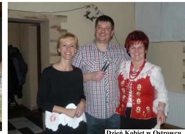
Dzień Kobiet w Ostrowcu

W Sołectwie Niemica panie świętowały 06 marca. Uroczystość, w której