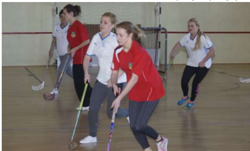
Fragment meczu UG Malechowo - SP Lejkowo

Podczas imprezy odbywały się licytacje różnych przedmiotów, można też było posmakować pysznych ciast i słodkości oraz aromatycznej kawy w specjalnie