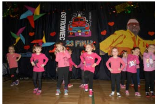
Finał gminny w ZS Ostrowiec

Wielka Orkiestra Świątecznej Pomocy zagrała w tym roku już po raz 23, a w Zespole Szkół im. Mikołaja Kopernika w Ostrowcu grały już od 2 dekad.