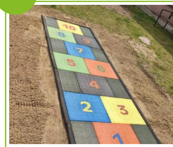
Gra parkowa typu „w klasy”

Produkty prezentowane na zdjęciach są poglądowe i w rzeczywistości mogą się różnić. Katalog nie obejmuje kosztów montażu. Organizator nie świadczy usługi montażu.