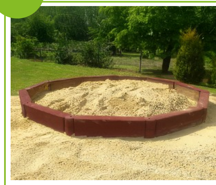
Piaskownica z elementów gumowych

Produkty prezentowane na zdjęciach są poglądowe i w rzeczywistości mogą się różnić. Katalog nie obejmuje kosztów montażu. Organizator nie świadczy usługi montażu.